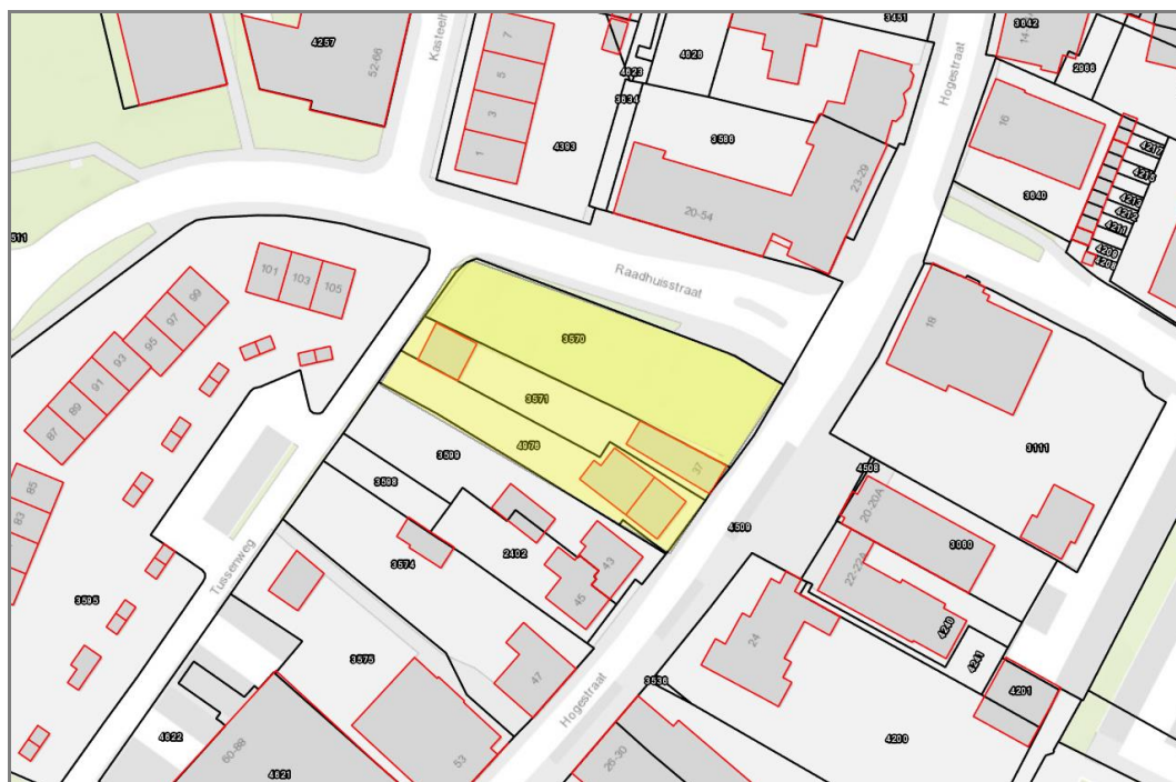
Figuur 1. Kadastrale gegevens project Hogestraat

Het plangebied ligt in het centrum van Druten en behelst de realisatie van 6 á 7 grondgebonden woningen en een appartementencomplex met 3 á 4 appartementen en een commerciële functie op de begane grond. Figuur 1 toont de kadastrale gegevens, het plangebied is geel gearceerd.