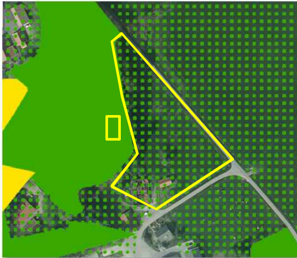
Ligging van de EHS-gronden rondom het onderzoeksgebied (gele lijn).