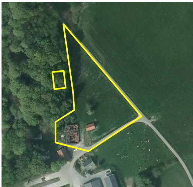
Detailopname van het onderzoeksgebied; deze wordt met de gele lijn aangeduid.

Het onderzoeksgebied bestaat deels uit een agrarisch erf en deels uit grasland. In het onderzoeksgebied staan enkele agrarische bijgebouwen zoals een stenen- en een houten schuur en een vervallen boerderij. Op onderstaande afbeelding wordt het onderzoeksgebied weergegeven. De te slopen houten schuur staat in het bos en is op de luchtfoto niet zichtbaar.