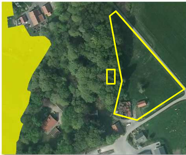
Ligging van Natura 2000-gebied rondom het onderzoeksgebied (gele lijn).

Het onderzoeksgebied ligt ca. 100 meter ten oosten van het Natura 2000-gebied 'Landgoederen Oldenzaal', zoals zichtbaar op onderstaande afbeelding. In een straal van 1 kilometer ligt geen Beschermd Natuurmonument-gebied (bron: Provincie Overijssel, 2014).