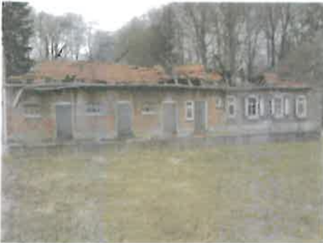
Scheurvorming en verzakking keermuur.

De baksteen keermuur is door scheurvorming en verzakking slecht.