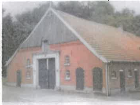
Zeer streekeigen uitstraling achtergevel.