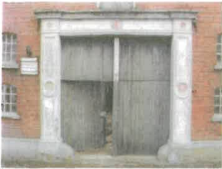
Zeer streekeigen gepleisterde omlijsting.