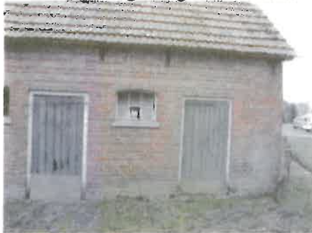
Los metselwerk en ingetrotte deuren.