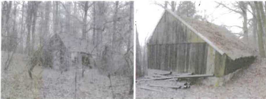
Karakteristiek gelegen kippenhok is zeer het behouden waard.

Gezien de cultuurhistorische waarde en de zeer karakteristieke ligging is het kippen hok zeer het behouden waard. Gezien de slechte staat dient het kippenhok met hergebruik van borstwering en panbedekking nieuw opgebouwd te worden.