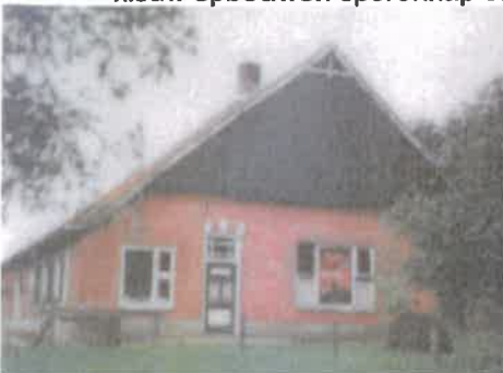
Indeling voorgevel is al eens aangepast.