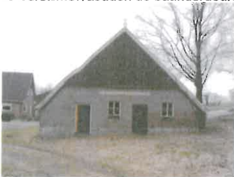
Terug brengen baanderdeuren achtergevel.

Voor behoud dienen verschillende onderhoudswerkzaamheden te worden uitgevoerd en om het streekeigen karakter te versterken zouden de baanderdeuren in de achtergevel weer terug gebracht kunnen worden.