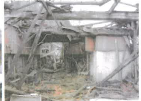
Interieur met schouw op de deel.