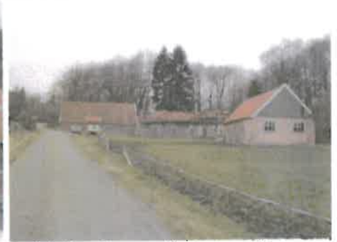
Oude bebouwing vormt fraai ensemble.