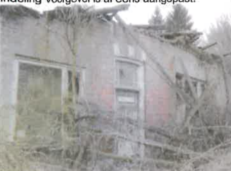
Huidige toestand voorgevel.