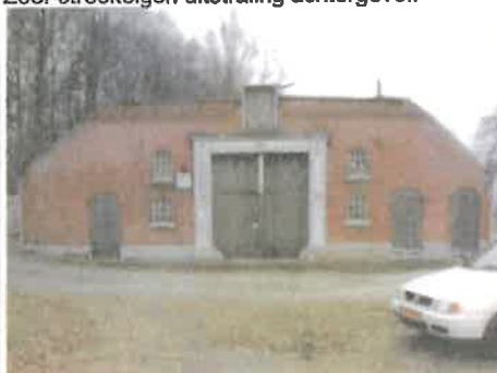
Huidige toestand achtergevel.