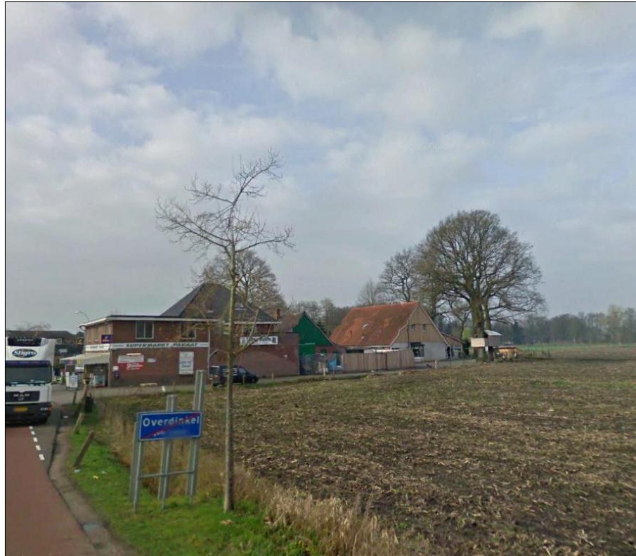
Aanzicht achterzijde plangebied met de naastgelegen supermarkt