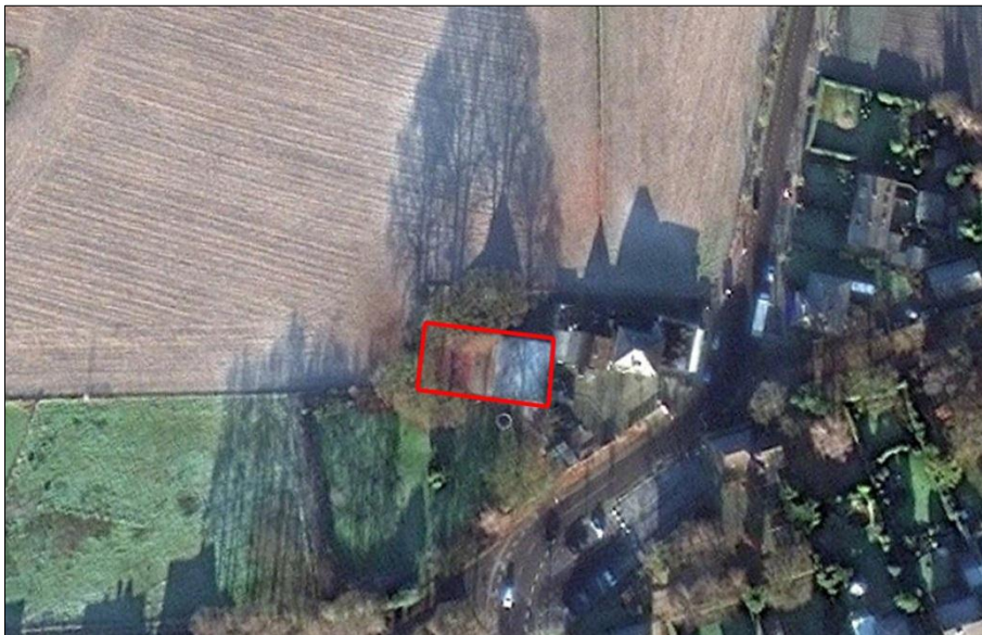
Luchtfoto met in rood het plangebied

In het plangebied bevindt zich één woning. Ten oosten grenst het plangebied aan Paraat Supermarkt B.V. Aan de achterzijde grenst het plangebied aan een akker.