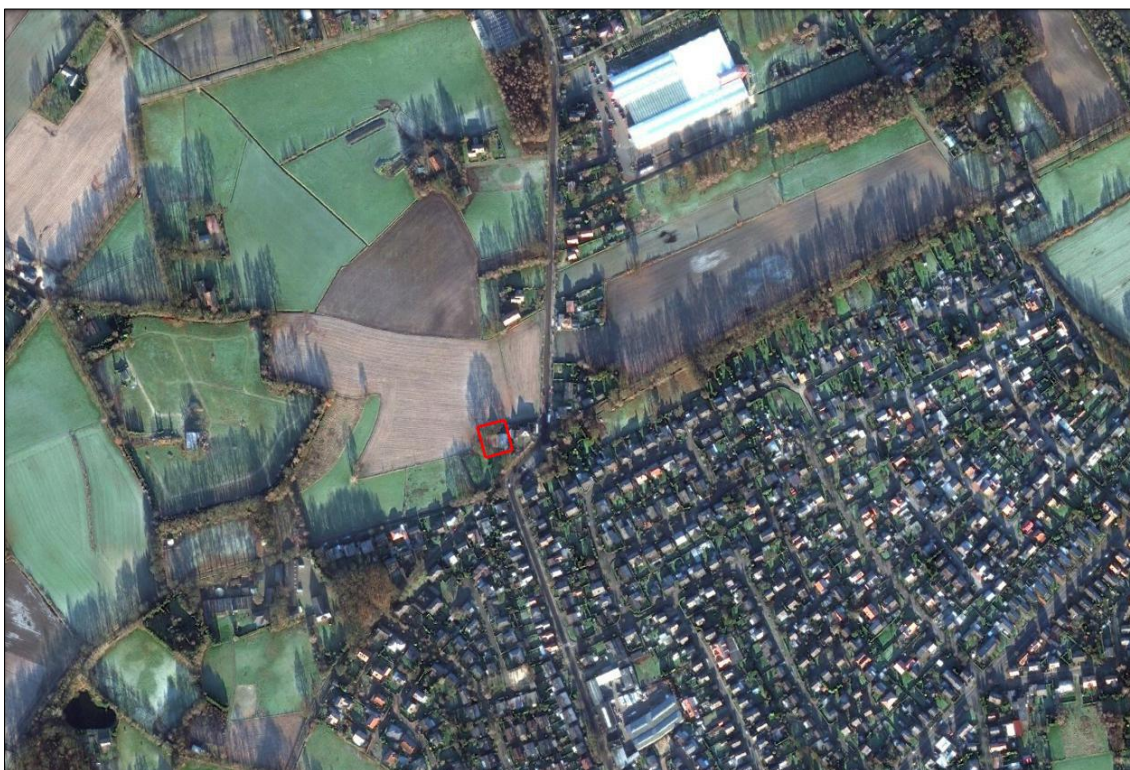
Gemeente Losser