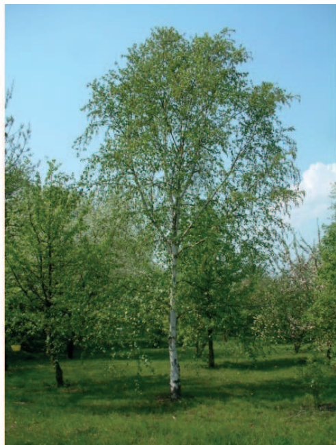
Figuur 7. Transparantie van een berk

In combinatie met de beukenhaag zullen de solitair en in groepen geplaatste berkenbomen het bedrijfsgebouw groen aankleden. De gebiedseigen bomen geven visueel de erfgrans weer.