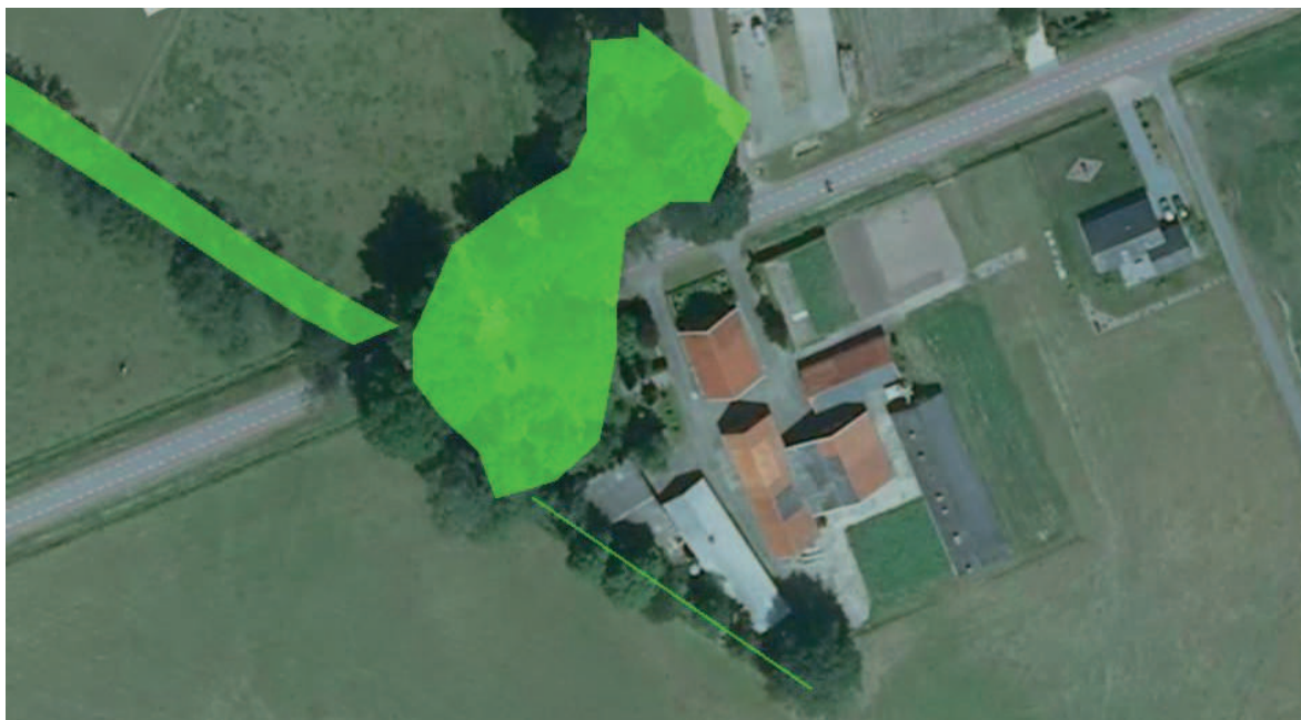
Figuur 6. Casco kaart van het erf

Figuur 6 toont de Casco kaart met daarop een aantal elementen die moeten worden behouden en/of worden versterkt. Volgens de kaart valt de houtwal én de fruitboomgaard onder de Casco. Navraag bij de gemeente heeft ertoe geleid dat zij kenbaar hebben gemaakt dat de fruitboomgaard geen deel uit maakt van de Casco en dat er met het opstellen van de kaart wellicht een vergissing is gemaakt. De houtwal blijft echter wel gelden onder het Casco beleid.