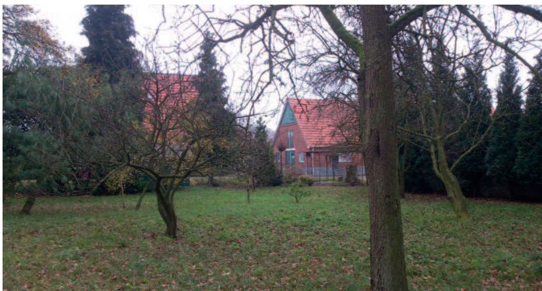
Figuur 2. Fruitboomgaard

In hoofdstuk 2 van dit rapport zullen de diverse landschapstypen worden toegelicht, waarna in hoofdstuk 3 een korte samenvatting wordt gegeven van de aanwezige beplantingen. Hoofdstuk 4 toont de Casco kaart en hoofdstuk 5 geeft een toelichting op het erfbeplantingsplan.