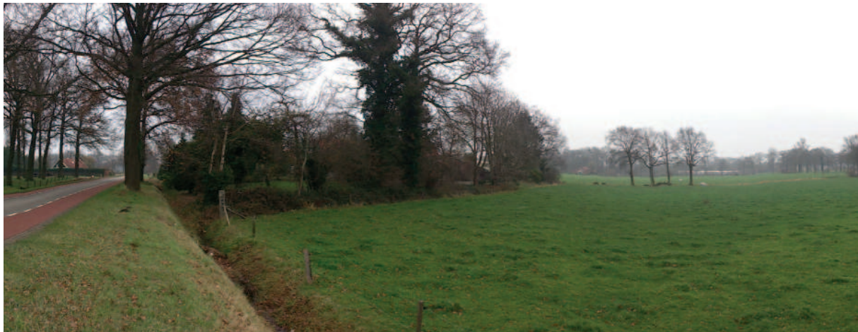
Figuur 1. Op de achtergrond het erf van de familie Mulder

Op het erf zal een goed onderscheid herkenbaar zijn tussen het woonhuis en het bedrijfspand. De zuilbeuken - die eveneens de zichtlijn richting het open landschap versterken - zorgen mede voor deze tweedeling op het erf. Middels de landschappelijk inpassing ontstaat er in zijn totaliteit synergie tussen wonen én werk zonder hierbij de natuurlijke omgeving schade te berokkenen.