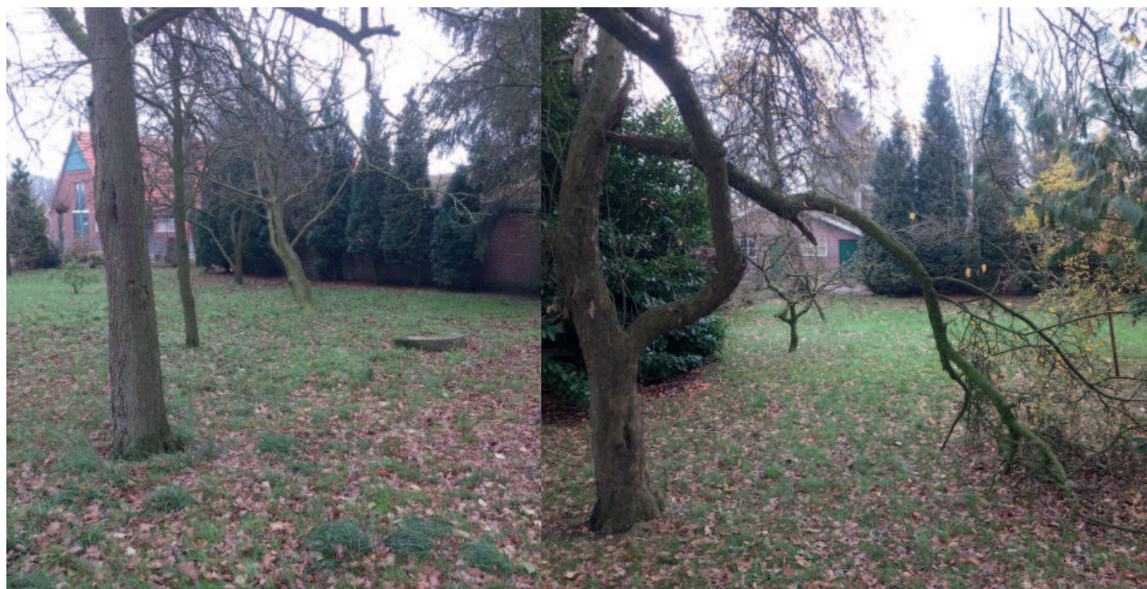
Figuur 8. Huidige fruitboomgaard met gezonde maar ook slecht onderhouden bomen

De fruitboomgaard is slecht onderhouden en zal worden aangevuld met een 8-tal hoogstam fruitbomen. Een deel van de bomen in de fruitboomgaard is uitgegroeid tot mooie volgroeide volwassen fruitbomen en een aantal bomen tonen achterstallig snoeionderhoud en uitgescheurde takken.