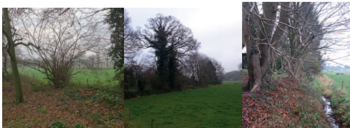
Figuur 5. Foto's houtwal - hazelaars - eikenbomen - paardenkastanjes