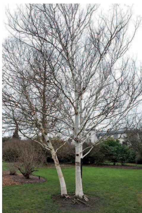
Figuur 9. Meerstammige berk

Evenals de berkenbomen op de erfrens - element 2 - zullen de meerstammige berken het bedrijfsgebouw groen aankleden. De natuurlijke uitstraling van de bomen met de grillige stammen én de gebiedseigen bomen zorgen voor een representatief contrast met het bedrijfsgebouw en de woning.