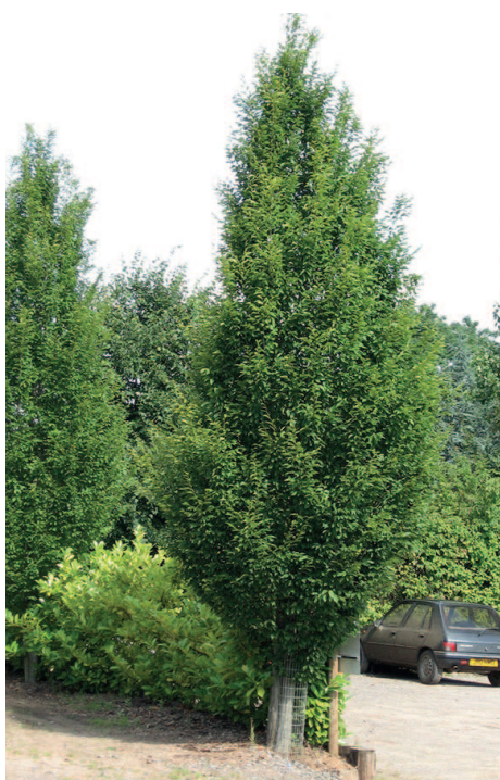
Figuur 10. De zuilbeuken