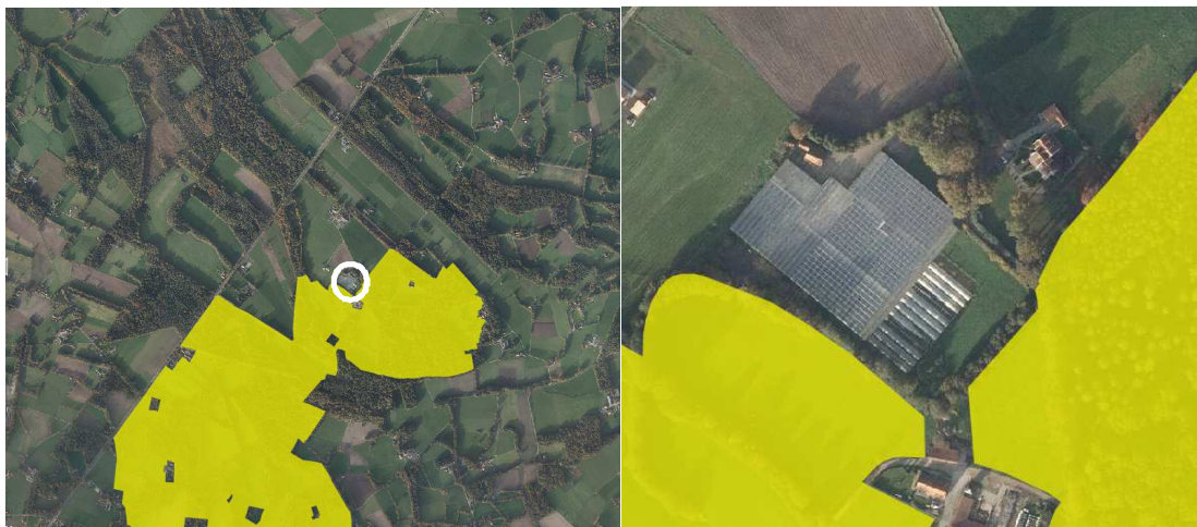
Ligging van Natura2000-gebied in de omgeving van het plangebied.

Het plangebied ligt niet in Natura2000-gebied, maar grenst aan de zuid- en oostzijde bijna aan gronden die tot Natura2000-gebied 'Landgoederen Oldenzaal' behoren. Op onderstaande kaarten wordt de ligging van Natura2000-gebied in de omgeving van het plangebied weergegeven.