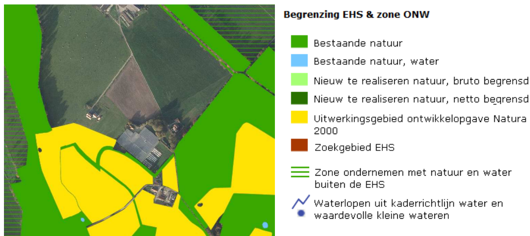
Ligging van de EHS nabij het plangebied.

Het plangebied ligt niet in de EHS, maar grenst aan de zuid- en oostzijde aan gronden die tot de EHS behoren. Op onderstaande kaart wordt de ligging van de EHS in de omgeving van het plangebied weergegeven.