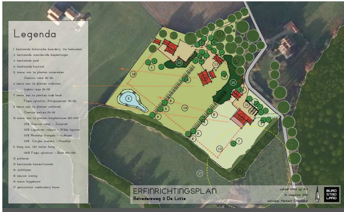
Impressie van de nieuwe erfopzet.

Het voorgenomen plan bestaat uit het slopen van de glaskassen en tunnelkassen. Na de sloop worden twee vrijstaande woningen met bijgebouw gebouwd. De nieuwe woonerven worden landschappelijk ingepast door middel van erfbeplanting. Op onderstaande afbeelding wordt de wenselijke nieuwe situatie weergegeven.