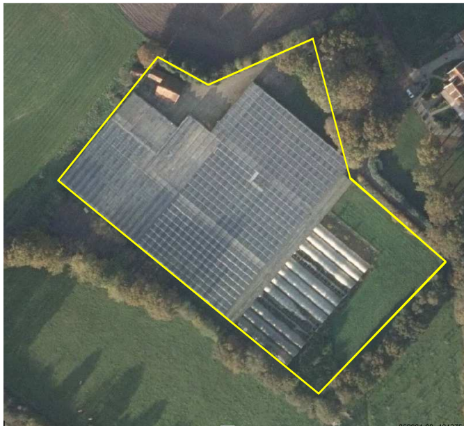
Detailopname van het plangebied.

In het plangebied staan een kassencomplex, enkele tunnelkassen en een oude boerderij met een bijgebouw. Ten oosten van de kassen ligt een strook grasland. De boerderij en het bijgebouw zijn gedekt met gebakken pannen; de gebouwen beschikken niet over dak- en/of wandisolatie. Het grasland bestaat uit een soortenarme vegetatie van hoofdzakelijk raaigras. Het centrale kassencomplex is bestaand uit glazen kassen. De tunnelkassen zijn gemaakt van plastic folie.