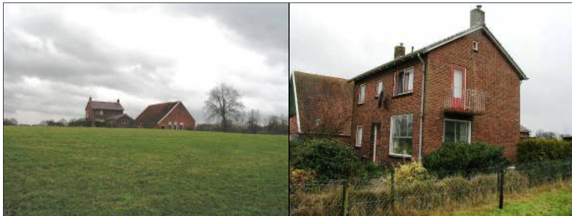
Situatie in het plangebied d.d. 25 februari 2010

faunawet en/of een oriënterend onderzoek in het kader van de Natuurbeschermingswet 1998 of de Ecologische Hoofdstructuur noodzakelijk is. Het plangebied is daartoe op 25 februari 2010 bezocht door een ecooloog van BügelHajema Adviseurs.