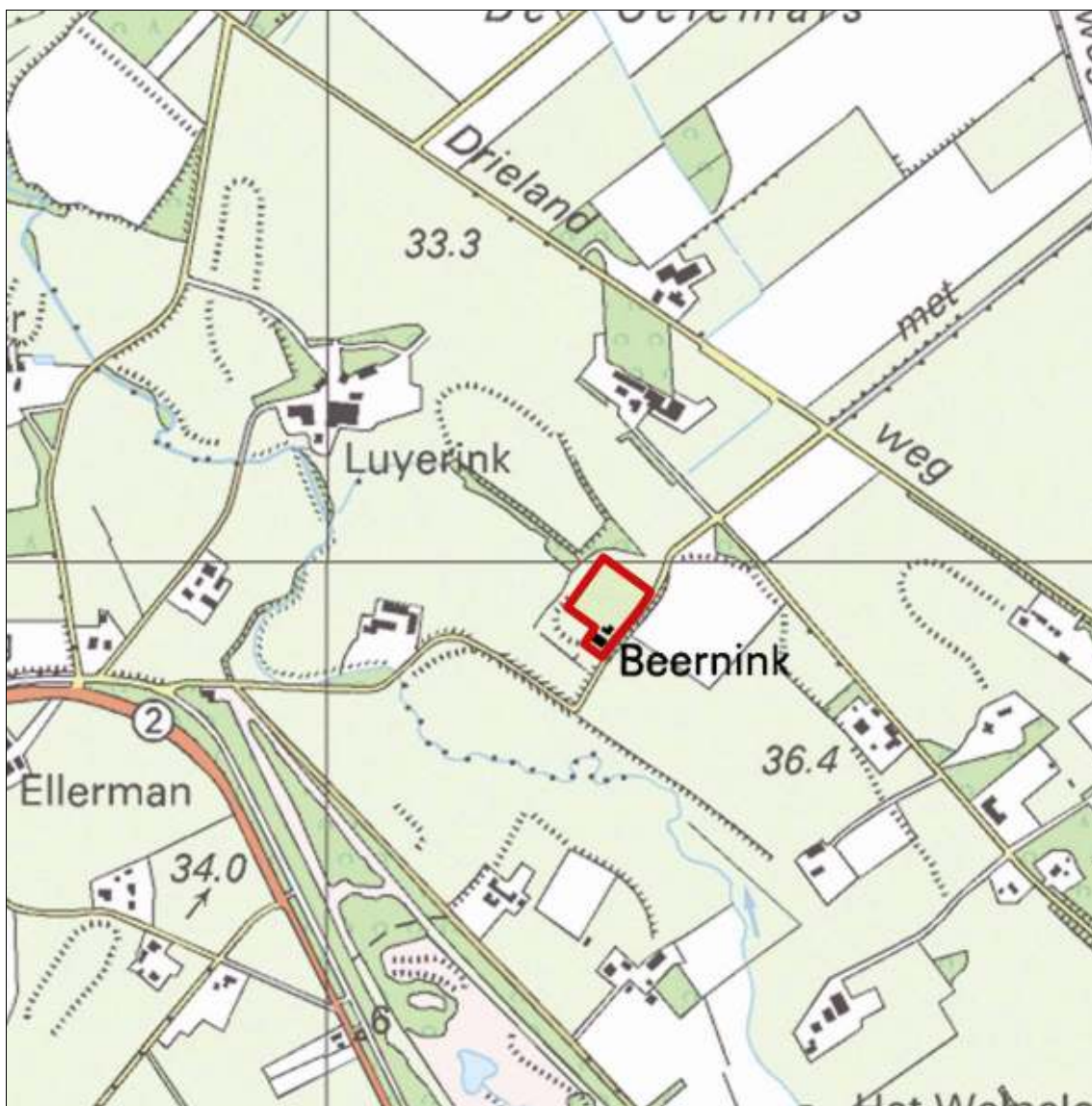
Gemeente Losser