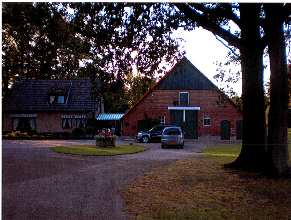
Figuur 2 het erf aan de Snippertweg 12. Links het woonhuis en rechts de te slopen schuur

Elke ruimtelijke ontwikkeling of inrichting moet worden getoetst aan de Flora- en faunawet. Eelerwoude heeft van de heer J. Rudolf opdracht gekregen om deze toetsing voor de locatie aan de Snippertweg 12 te Losser uit te voeren.