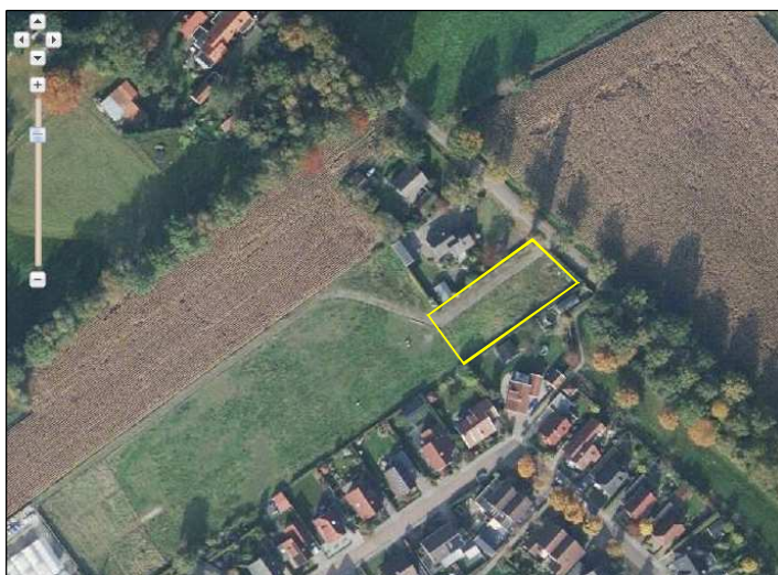
Detailweergave en begrenzing van het plangebied. De ligging van het plangebied wordt met de gele lijn aangeduid.

Het plangebied bestaat uit erfverharding, opgaande beplanting en grasland. Parallel langs de Invalsweg staat een coniferen scheerhaag. Direct achter de scheerhaag liggen enkele vierkante meters erfverharding. Langs de noordgrens van het perceel ligt een klinkerpad. Het overgrote deel van het plangebied bestaat uit agrarisch cultuurland, tijdens het veldbezoek in gebruik als grasland. Het grasland wordt intensief gebruikt en wordt jaarlijks gemaaid waarbij het maaisel wordt afgevoerd. Tijdens het veldbezoek lag er groenafval opgeslagen op de erfverharding. Het plangebied grenst aan de noord- en zuidzijde aan een woonerf. Aan de westzijde grenst het aan agrarische cultuurgrond. Op onderstaande luchtfoto wordt het plangebied in detail weergegeven, evenals de begrenzing.