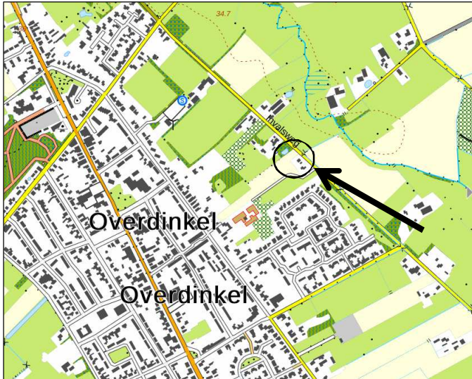
Globale ligging van het plangebied. De ligging van het plangebied wordt met de cirkel aangeduid.

Het plangebied is gesitueerd aan de Invalsweg te Overdinkel. Het plangebied ligt iets ten zuidoosten van het adres Invalsweg 8a. Het ligt in het buitengebied, net ten oosten van de woonkern Overdinkel. Op onderstaande uitsnede van de topografische kaart wordt de globale ligging van het plangebied aangeduid met de cirkel.