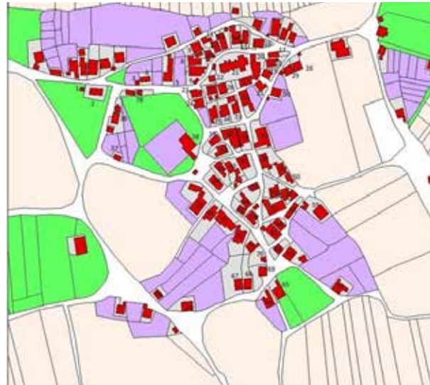
Uitsnede kadastrale kaart, circa 1832.