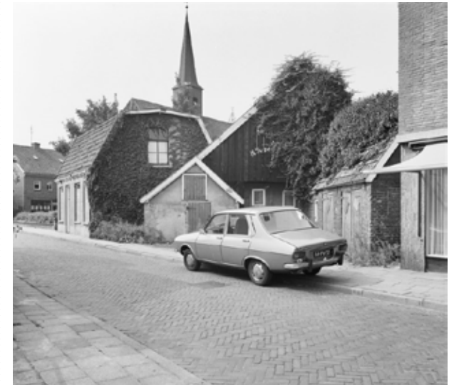
't Hengelhoes, historische foto vanaf de kerk voor herbouw.