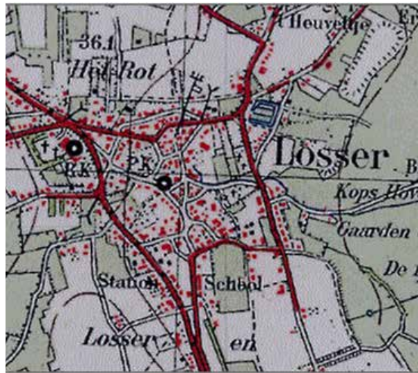
Kaart van Overijssel met Losser uit 1935 (bron: Toen en Nu).