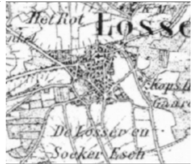
Uitsnede topografische kaart 1850. Duidelijk te zien hoe de kerk gelegen is in de dorpskern.