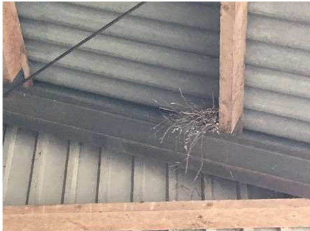
Oud nest van een houtduif in de kapschuur.

Het onderzoeksgebied behoort tot het functionele leefgebied van verschillende vogelsoorten. Vogels benutten het plangebied als foerageergebied en als nestplaats. Vogelsoorten als houtduif, holenduif, merel en witte kwikstaart kunnen nestelen in/aan de bebouwing in het plangebied. Ze kunnen nestelen in het dakvlak, in/aan nissen en gaten en in/op opgeslagen goederen/materieel. In de kapschuur is een oud nest van een houtduif aangetroffen.