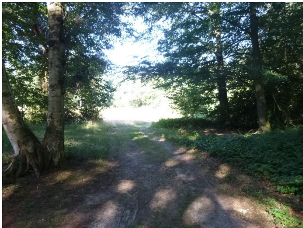
Pad naar Omleidingskanaal