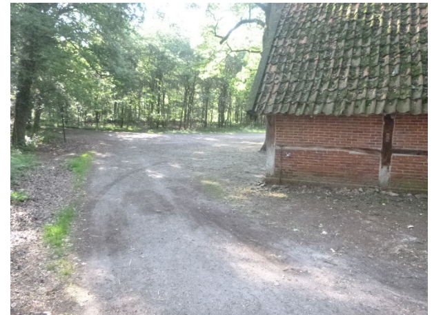
Verharding asfaltgranulaat rondom boerderij