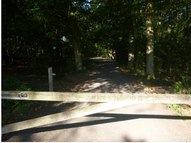
Toegang vanaf Lutterzandweg