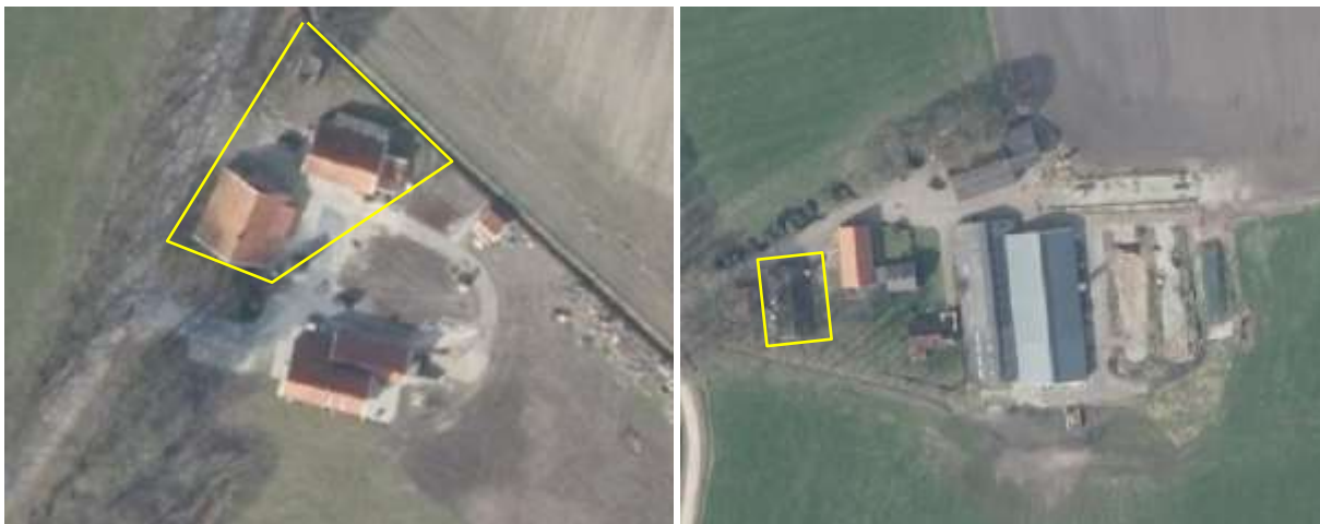
Foto links: deelgebied Oude Dijk. Foto rechts: deelgebied Stroothuizerweg. De begrenzing van het plangebied wordt met de gele lijn aangeduid.

Het plangebied bestaat volledig uit bebouwing. In het deelgebied staat een voormalige varkensstal. Het gebouw is gebouwd van bakstenen en is gedekt met golfplaten. Het gebouw beschikt vermoedelijk over een (geïsoleerde) spouw, maar niet over een beschoten kap. De stal staat reeds geruime tijd leeg. De staat van onderhoud van de stal is goed; het gebouw is wind- en waterdicht. Op onderstaande luchtfoto's worden beide deelgebieden in detail weergegeven.