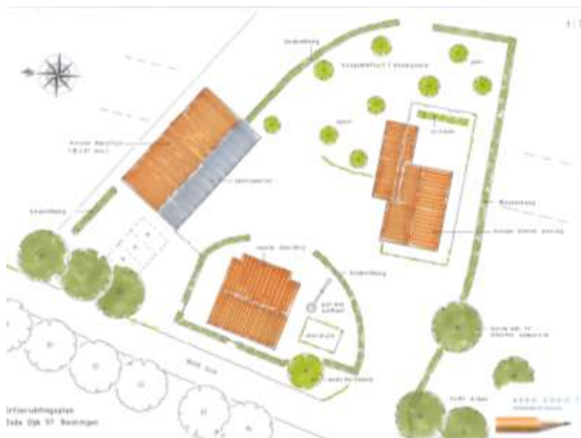
Verbeelding van het wenselijke eindbeeld in deelgebied Oude Dijk.

Het concrete voornemen bestaat om de noordelijke schuur in deelgebied Oude Dijk te slopen en een nieuwe, grotere schuur op het erf te bouwen, iets ten noorden van de huidige bouwplaats. Ter compensatie wordt een voormalige varkensstal aan de Stroothuizerweg 43-45 gesloopt. Het erf wordt nadien landschappelijk ingepast. Op onderstaande afbeelding wordt het wenselijke eindbeeld in deelgebied Oude Dijk weergegeven.