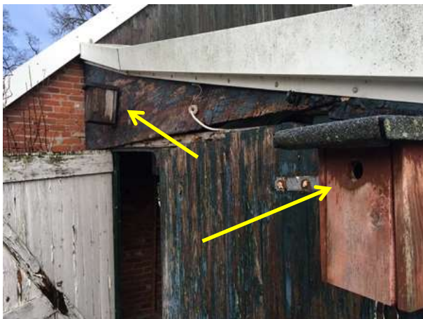
Nestkasten voor kool- of pimpelmees in deelgebied Oude Dijk.

Het plangebied maakt onderdeel uit van het functionele leefgebied van verschillende vogelsoorten. Het vormt een ongeschikt foerageergebied, maar vermoedelijk nestelen er ieder voorjaar vogels in de te slopen schuur in deelgebied Oude Dijk. Soorten die mogelijk in de aangetroffen nestkasten of schuur nestelen zijn koolmees, pimpelmees, witte kwikstaart, merel, houtduif en holenduif. Op het erf zijn huismussen waargenomen, maar die nestelen niet in de te slopen schuur. Vanwege het ontbreken van een beschoten kap vormt de schuur een ongeschikte nestplaats voor huismussen. Ook zijn in de schuur geen aanwijzingen gevonden dat steen- of kerkuil de schuur benutten als rust- of nestplaats. De te slopen varkensstal vormt een voor vogels ongeschikte nestplaats.