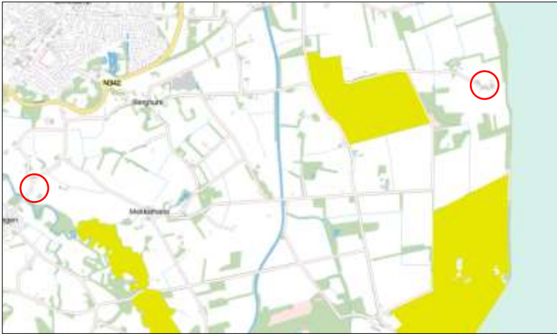
Ligging van Natura2000-gebied in de omgeving van beide deelgebieden. De ligging van de deelgebieden wordt met de rode cirkel aangegeven. Gronden die tot Natura2000 behoren worden met de okergele kleur aangeduid.