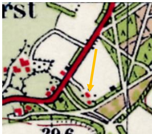
Afbeelding 3 situatie 1950