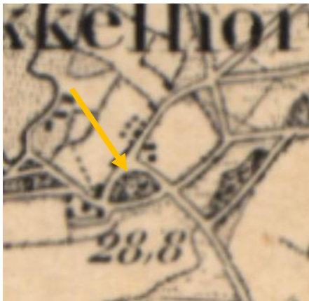
Afbeelding 2 situatie 1900

De boerderij is een rijksmonument. Het gebouw staat in het veld tussen de Mensmanweg aan de zuidkant en de Mekkelhorsterstraat aan de noordkant. Ten zuidwesten van het gebouw staan stallen van het naastgelegen boerenbedrijf, van het veld gescheiden door een beplanting van bomen en struiken. Bij de boerderij zelf staat een grote kastanjeboom. Een put verwijst naar het oude erf. Een toegangsweg en bijgebouwen ontbreken. De boerderij is een overblijfsel van een erf wat hier tenminste tussen 1880 en 1950 is geweest; rond eind 19e eeuw lag het meer aan de Mekkelhorsterstraat.