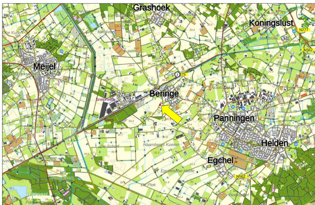
Figuur 1. Topografische kaart ligging van het plangebied (1:25.000)

Het plangebied is gelegen ten zuidwesten van Beringe, gemeente Peel en Maas. In figuur 1 is de topografische ligging van het plangebied weergegeven.