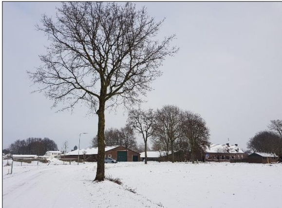
Figuur 6. Noordelijk deel plangebied vanuit westen