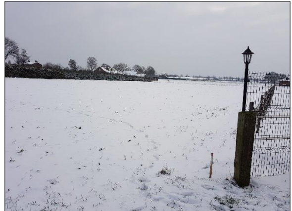
Figuur 7. Plangebied vanuit westen