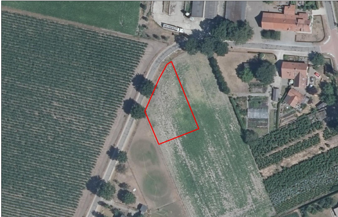
Figuur 2. Luchtfoto van het plangebied en de directe omgeving