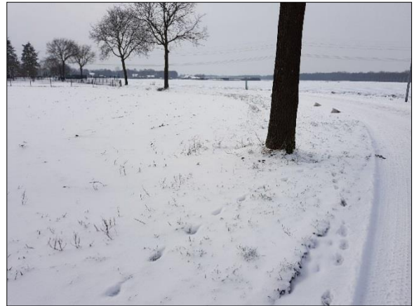
Figuur 5. Noordelijk deel plangebied vanuit oosten