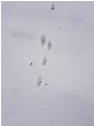
Figuur 8. Pootafdrukken konijn binnen plangebied