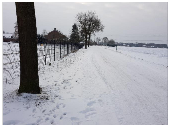
Figuur 9. Kampweg richting westen