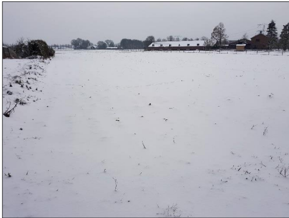
Figuur 4. Plangebied vanuit noordoosten