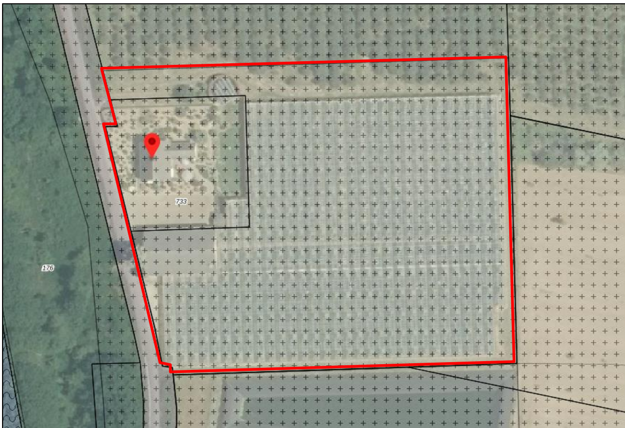
Afbeelding 2. Uitsnede verbeelding vigerend bestemmingsplan met rood omlijnd het bouwvlak en bij de rode pijl de beoogde plattelandswoning

Het plangebied staat kadastraal bekend als gemeente Maasbree, sectie L, nummers 732 (gedeeltelijk) en 733 en heeft een oppervlakte van circa 9.975 m 2 . De aanduiding 'Plattelandswoning' wordt aangebracht op het perceel L 733, dit perceel heeft een oppervlak van 1.460 m 2 .