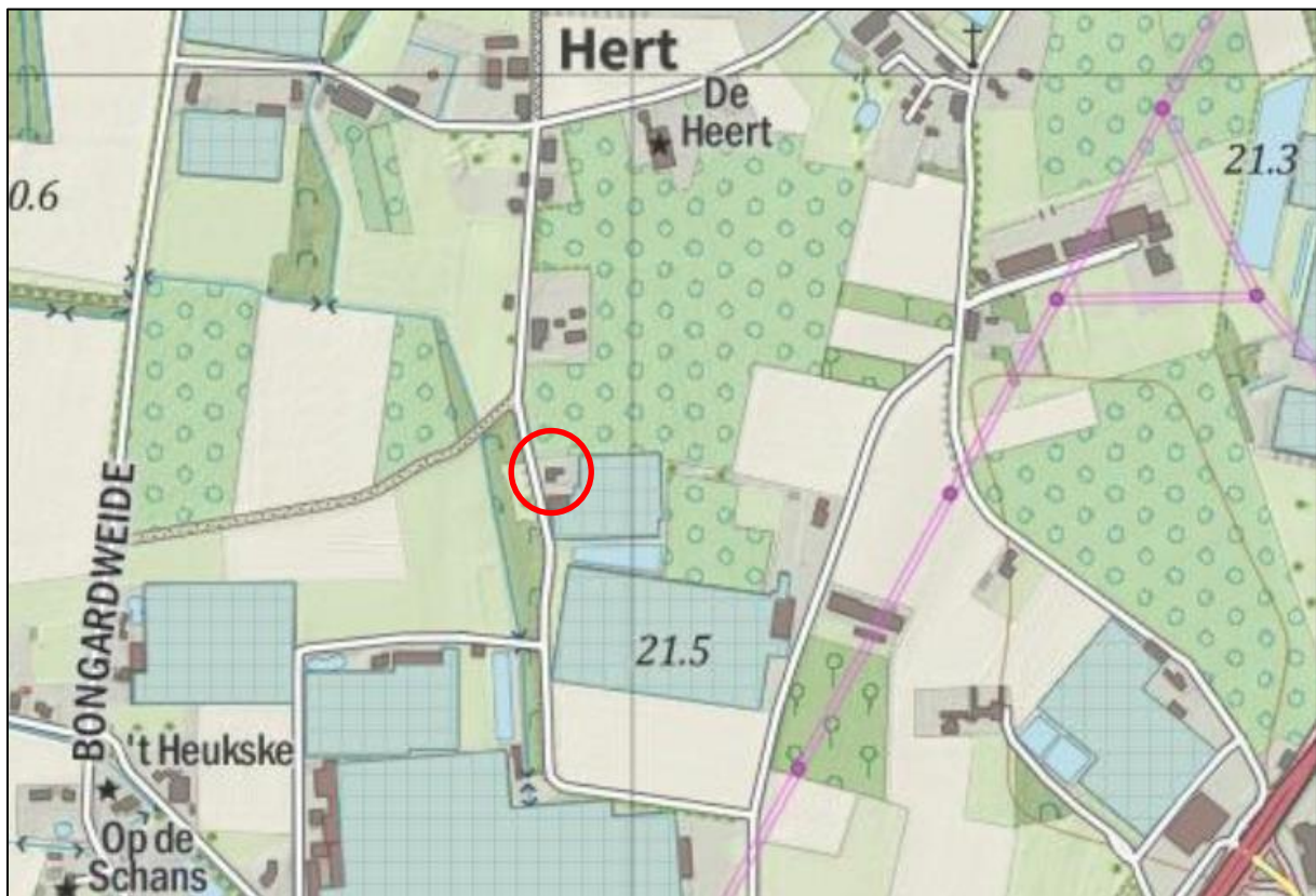
Afbeelding 1. Ligging plangebied, locatie Hert 3b rood omcirkeld

Initiatiefnemer, tevens eigenaar van de woning Hert 3b, heeft daarom een principeverzoek bij de gemeente Peel en Maas ingediend voor het omzetten van de bedrijfswoning naar een 'Plattelandswoning'. Door het aanbrengen van deze aanduiding is het niet meer noodzakelijk dat de bewoner van de woning binding heeft met het agrarische bedrijf ter plaatse. De gemeente heeft in de reactie op het principeverzoek aangegeven onder voorwaarden in te kunnen stemmen met het plan. De voorwaarde houdt in dat er sprake moet zijn van een goede ruimtelijke ordening. Hierop wordt in dit plan uitgebreid ingegaan.