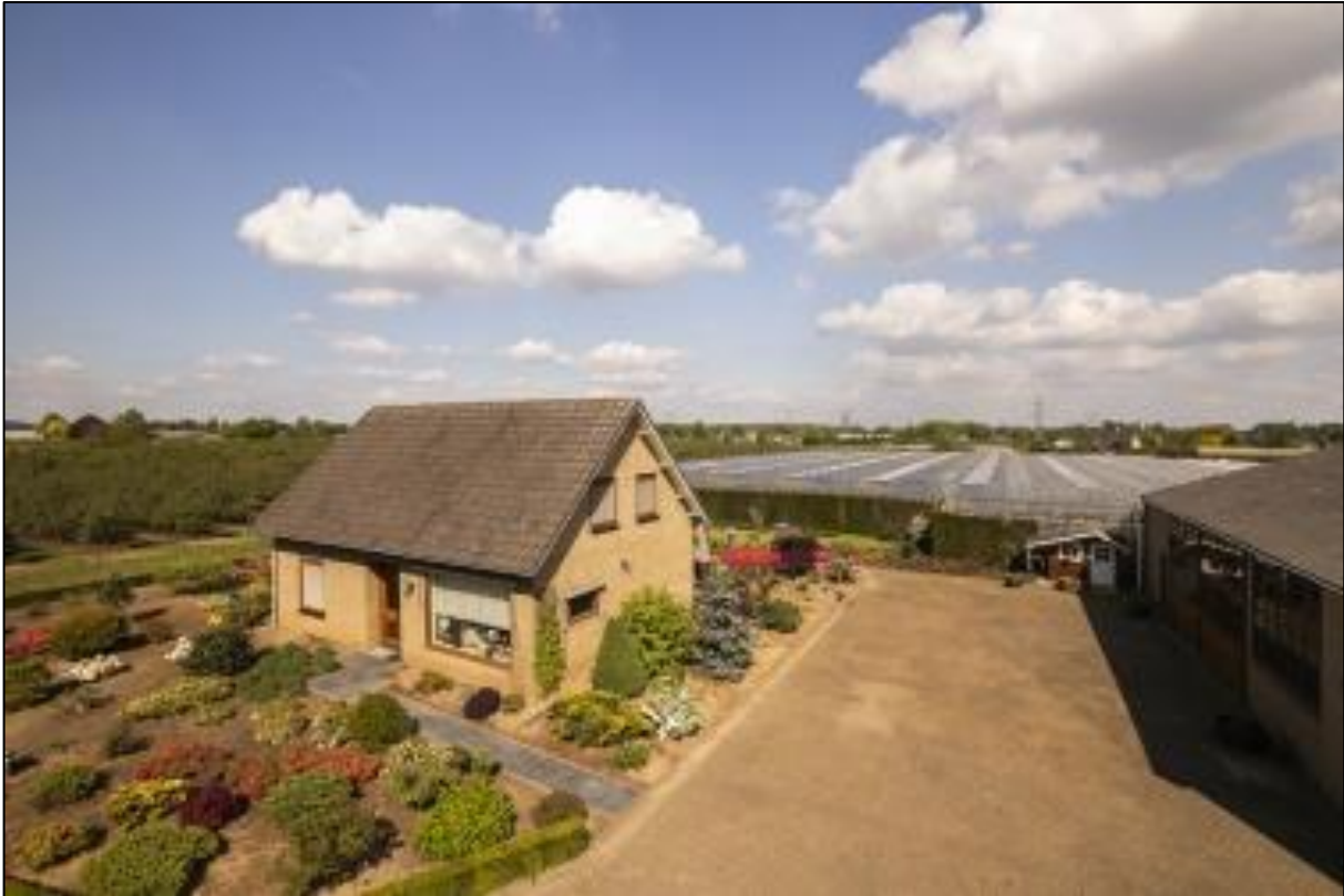
Afbeelding 4. Huidige situatie woning, met op de achtergrond de kassen die voorheen in eigendom waren van initiatiefnemer