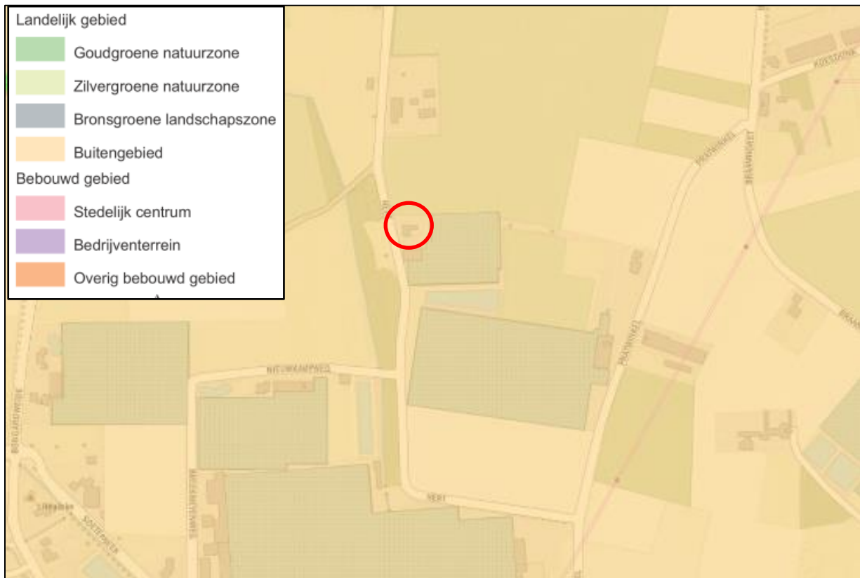
Afbeelding 5. Zonering Limburg POL2014

De kwaliteit van (de activiteiten in) het landelijk gebied draagt bij aan een aantrekkelijke woon- en leefklimaat in de steden en dorpen. Het aantrekkelijker en toegankelijker maken van het landelijk gebied voor toerisme en recreatie betekent overigens niet alleen dat agrariërs rekening houden met toeristen / burgers, maar zeker ook dat burgers worden aangesproken op begrip voor de bedrijfsvoering van agrariërs.