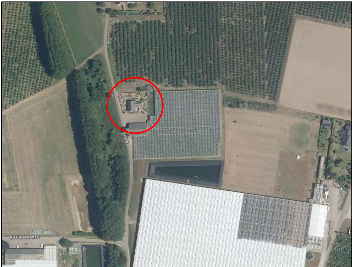
Afbeelding 3. Luchtfoto plangebied en omgeving

Het plangebied staat kadastraal bekend als gemeente Maasbree, sectie L, nummers 732 (gedeeltelijk) en 733 en heeft een oppervlakte van circa 9.975 m 2 . De aanduiding 'Plattelandswoning' wordt aangebracht op het perceel L 733, dit perceel heeft een oppervlakte van 1.460 m 2 .