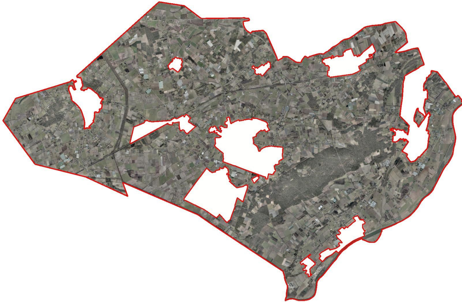
Kaart Plangebied Structuurvisie Buitengebied