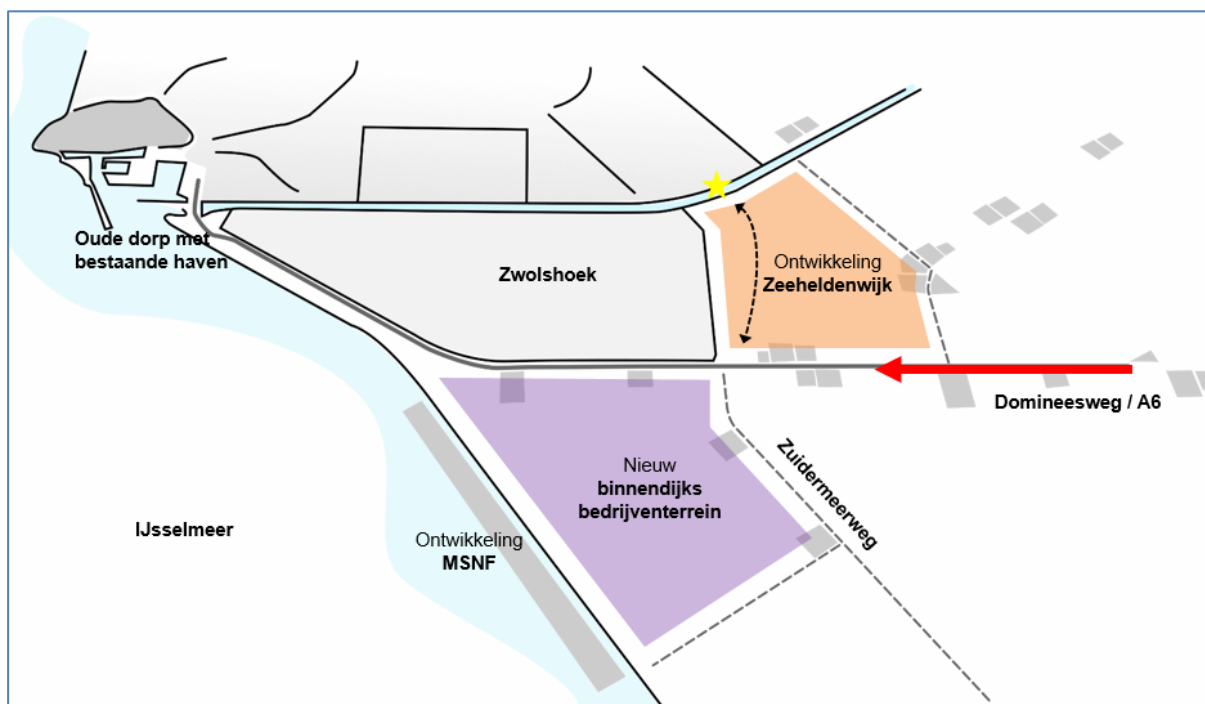
Afbeelding: ligging plangebied ten opzichte van Domineesweg

De bestaande verkeerstructuur bevindt zich hoofdzakelijk aan de randen van het plangebied. De meest prominente verkeerstructuur betreft de Domineesweg. De Domineesweg is een provinciale gebiedsontsluitingsweg en vormt voor Urk de belangrijkste verbinding tussen Urk en de A6.