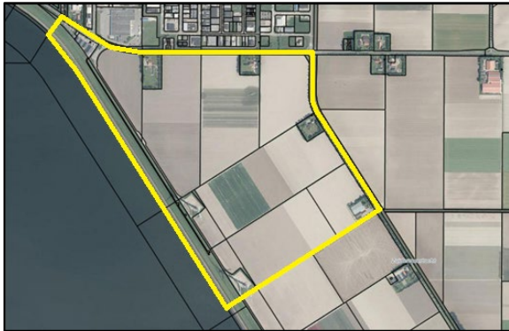
Afbeelding: globale begrenzing plangebied

Het plangebied is gelegen aan de zuidzijde van Urk aangrenzend aan het bestaand bebouwd gebied. Het gebied wordt aan de noordzijde begrensd door de N352 (Domineesweg) en het bestaande bedrijventerrein Zwolsehoek, ten oosten door de Zuidermeerweg en Zuidermeertocht en westelijk door de Zuidermeerdijk en de toekomstige MSNF. De ontsluiting van het plangebied loopt via de Domineesweg (N352) die verbonden is met de A6 als verbinding naar het zuiden langs Lelystad en Almere en als verbinding naar het noorden langs Emmeloord. Daarnaast wordt een deel van het gebied ontsloten vanaf de Zuidermeerweg. De Domineesweg vormt momenteel de zuidelijke begrenzing van het grootste bestaande bedrijventerrein Zwolsehoek.