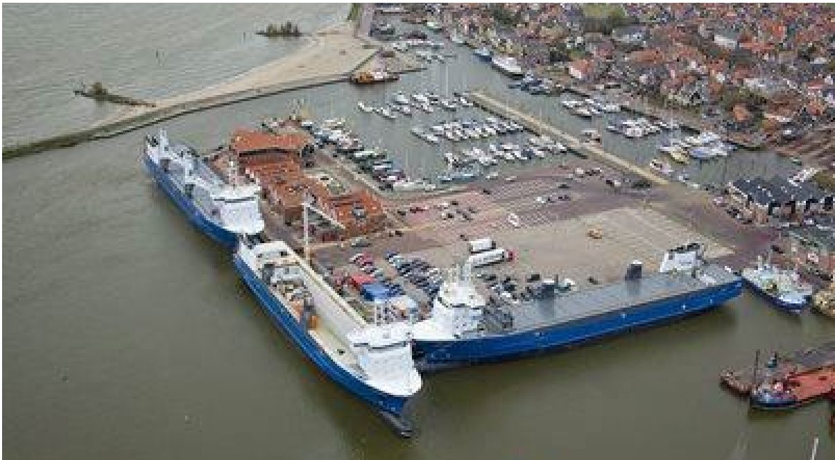
Foto: Bestaande haven Urk

Urk beschikt momenteel over de volgende bedrijventerreinen: Lemsterhoek (in transformatie naar een gemengd (voorzieningen)gebied, nu al een functiegemengd bedrijventerrein), Kamperhoek (in transformatie naar een woonwerk milieu) en Zwolsehoek. Het thans uitgeefbare aanbod van bedrijfslocaties op Urk is echter nihil. Op termijn wordt 2,0 hectare aan bedrijfsruimte voor bedrijven tot maximaal milieucategorie 2 voorzien (locatie Zeeheldenwijk ter afronding van de Zwolsehoek). Gezien de marktinteresse in de vorm van leads (voor in totaal ruim 30 hectare netto) is het uitgeefbare aanbod zonder uitbreidingsmogelijkheden te beperkt. Met name zwaardere bedrijvigheid met een hoge milieucategorie, zoals de visverwerking en de maritieme serviceverlening, kan binnen de gemeente Urk niet meer worden gefaciliteerd zonder de ontwikkeling van nieuw bedrijventerrein. De gemeente is voornemens te voorzien in deze uitbreidingsbehoefte door middel van het realiseren van het binnendijks bedrijventerrein.