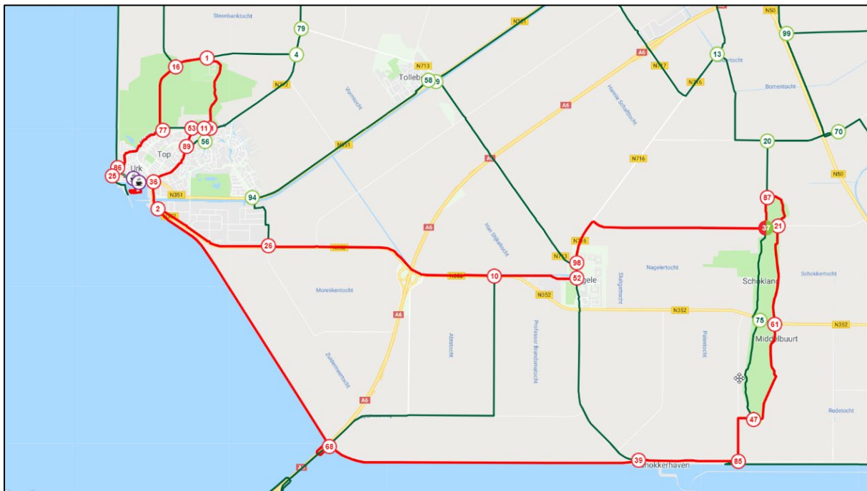
Afbeelding: fietsroute langs de cultuurhistorische waardevolle plekken: eiland en haven van Urk, Schokland en Nagele. Deze route wordt onder andere op www.visitflevoland.nl als toeristische attractie gepropageerd. De route komt op 2 punten langs het plangebied.

De fietsroute langs de Zuidermeerdijk maakt onderdeel uit van het netwerk van Landelijke Fietsroutes. Er zijn in Nederland enkele van dergelijke langeafstandsroutes die het land via kenmerkende landschappen doorkruisen. Deze routes zijn toeristisch waardevol.