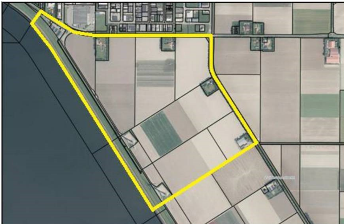
Figuur 1: ligging plangebied

De gemeente Urk is voornemens om een bedrijventerrein mogelijk te maken aan de zuidkant van het dorp. Hiervoor wordt een bestemmingsplan opgesteld. In het kader van het milieuaspect externe veiligheid is het bestemmingsplanvoornemen getoetst. Hierbij is gekeken welke invloed de bestaande risicobronnen hebben op het plangebied. Dit is getoetst conform wet- en regelgeving met betrekking tot externe veiligheid. Onderstaande afbeelding laat het planvoornemen zien.