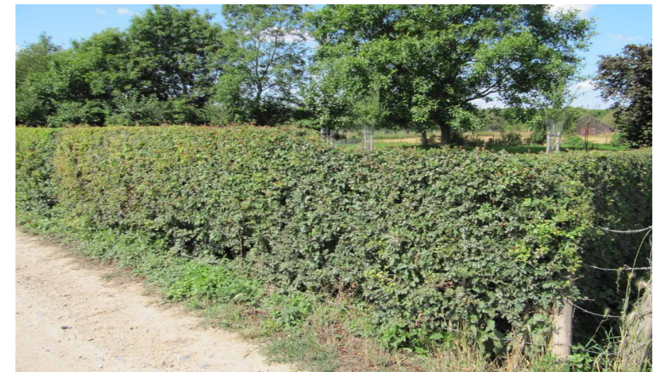
Foto 9: Voorbeeld van een haag van Eenstijlige meidoorn, met zicht op achterliggende weide.