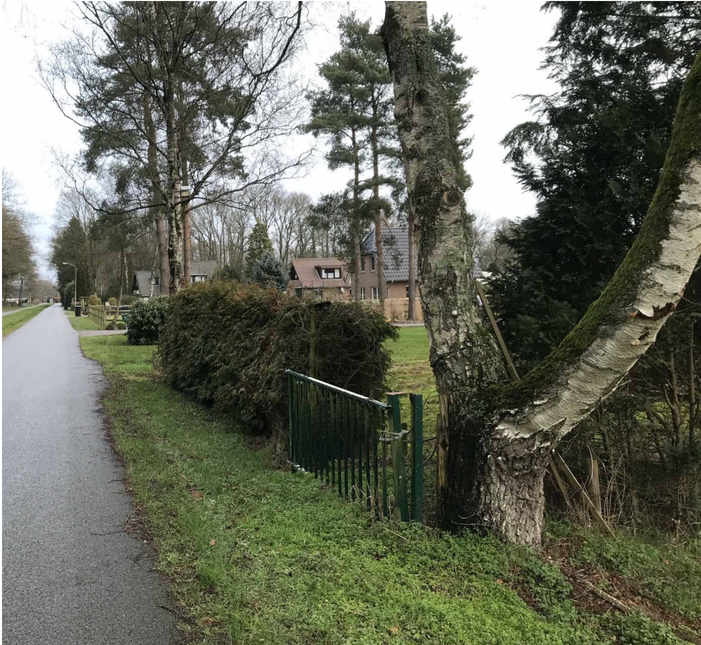
Foto 1: Behoud van karakterstieke en kenmerkende 'Veluwe' bomen (tweestammige Ruwe berk, Grove dennen).