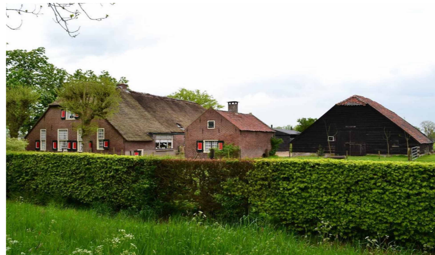
Foto 5: Voorbeeld van een (haag)beukenhaag, met zicht op voorhuis