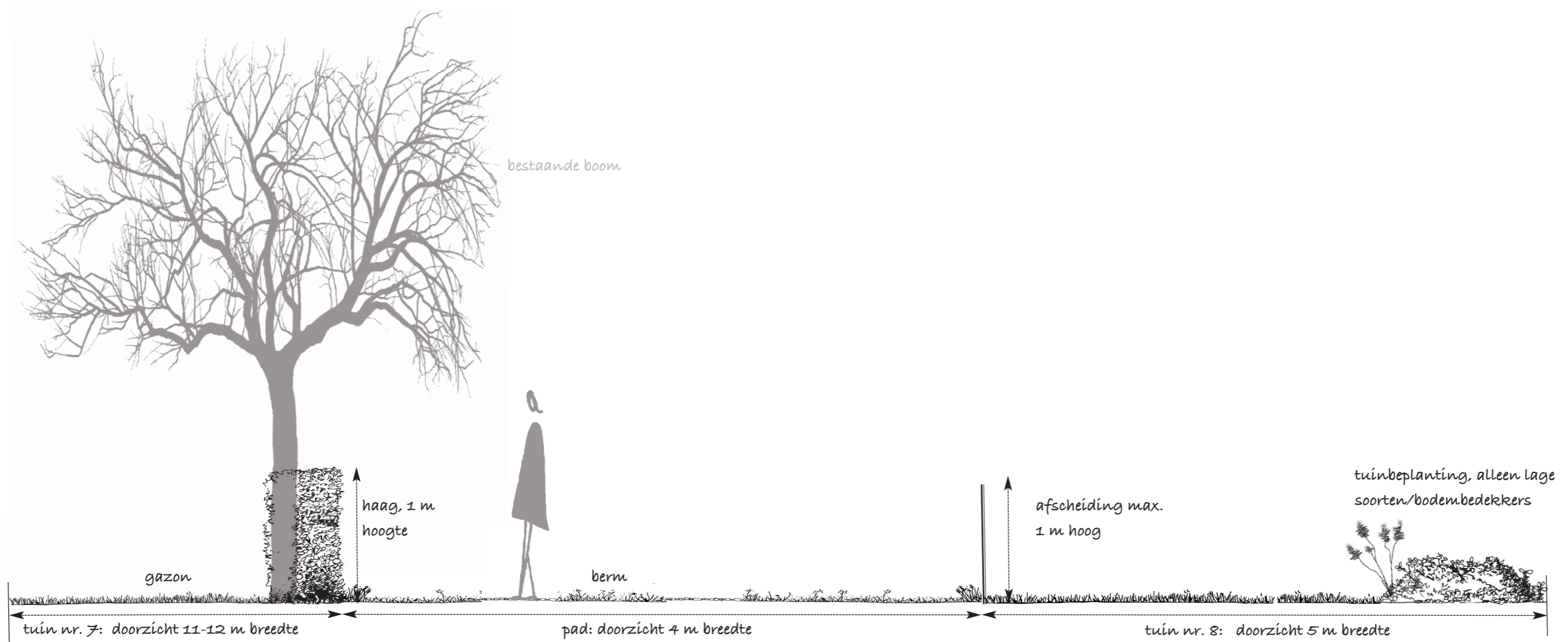
Afb. 2: Situatie aan de wegzijde en voorste deel weidepad (zie afb. 1, aanduiding nr. 2)