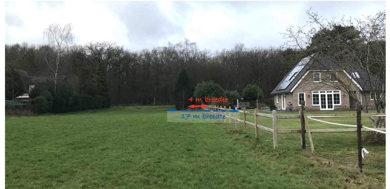
Foto 2: Locatie van de doorkijkzone (blauwe pijl) en weidepad (rode pijl), ingetekend op de huidige situatie.