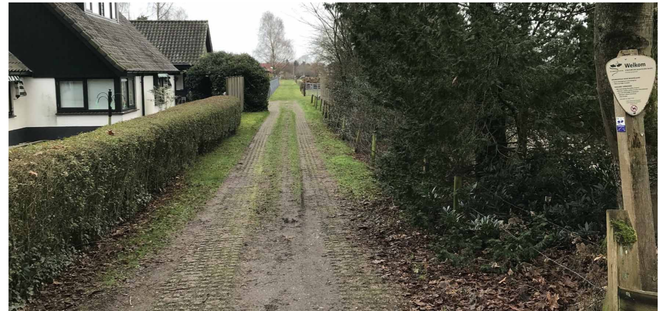
Foto 3: Soortgelijke doorkijk en boerenpad in de directe nabijheid (Parallelweg huisnummer 4).