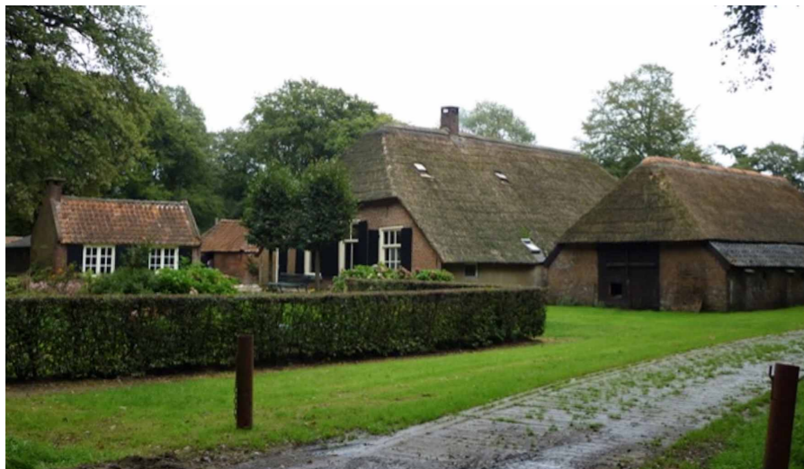
Foto 9: Voorbeeld van een haag van Gewone liguster met zicht op voorhuis.