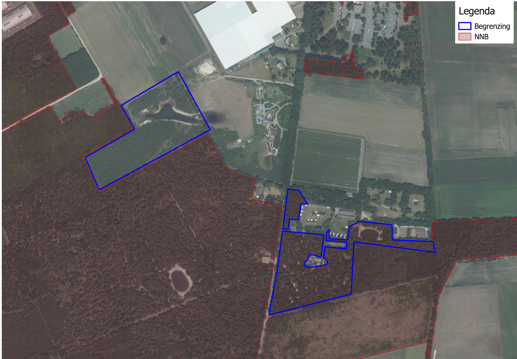
Luchtfoto met daarop ingetekend het te compenseren vlak (blauw, rechts), het vlak waar het NNB gecompenseerd zal worden (blauw, links) en de contouren van het huidige NNB (rood gearceerd)