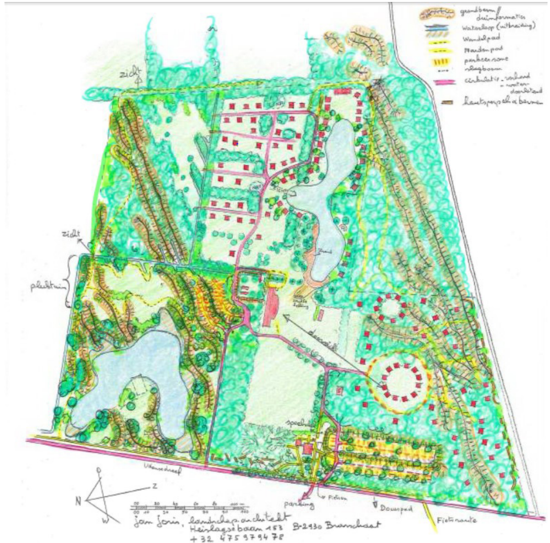
Schetsontwerp Camping de Holenberg