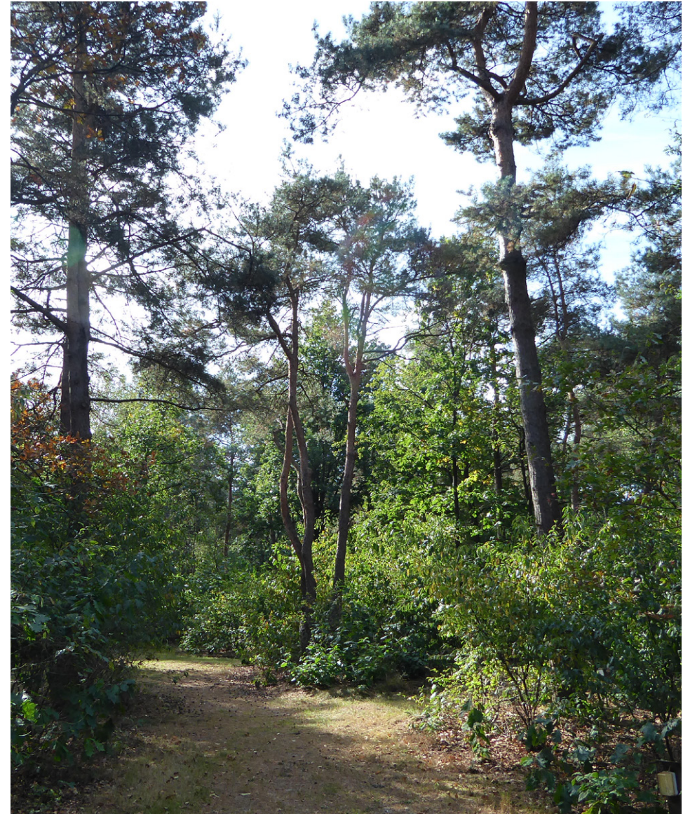
Huidige situatie NNB op Caming de Holenberg met de klok mee vanaf rechts: Hoofdboomsoort grove den met ondergroei van Amerikaanse vogelkers. De bestaande poel omringd door bos. Verjonging van Amerikaanse eik. Stacaravans in het NNB.