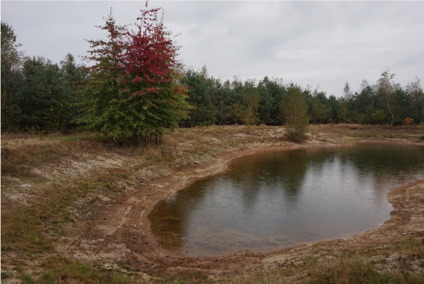
Bestaande poel met flauwe oevers op perceel waar het NNB gecompenseerd wordt