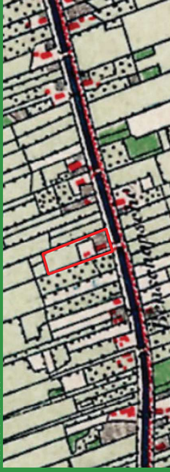
kadastrale kaart 1895