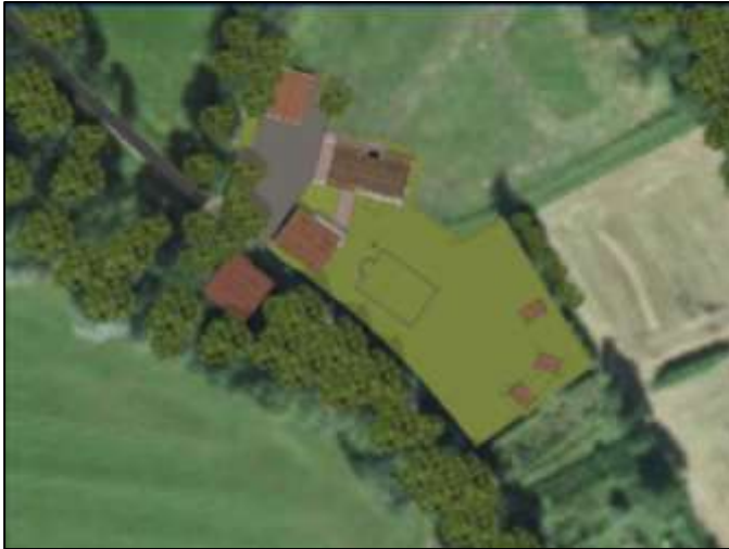
Verbeelding van het wenselijke eindbeeld.

Het concrete voornemen bestaat om de woonboerderij en tuinhuisje te slopen, de grote schuur te renoveren (o.a. het dak vervangen), erfverharding aan te leggen, en er een nieuwe woning en garage te bouwen, iets ten noorden van de huidige bouwplaats.