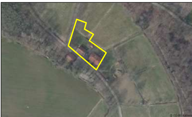
Detailopname van het plangebied. De begrenzing van het plangebied wordt met de gele lijn aangeduid.

In het plangebied staat een woonboerderij, een schuur en een tuinhuisje. Daaromheen ligt erfverharding, gazon, staat er een beukenhaag en staan er enkele sierplanten (struiken). De woonboerderij en grote schuur zijn gemaakt van bakstenen en bedekt met dakpannen. De stenen gebouwen beschikken niet over een (holle) spouw. De schuur beschikt niet over een beschoten kap, de woonboerderij heeft wel een beschoten kap. Het tuinhuisje is gemaakt van hout en bedekt met dakpannen. Het plangebied grenst aan de zuid- en westzijde aan openbare ruimte (Bavelweg) en een houtwal. Aan de noord- en oostzijde grenst het aan landbouwgrond. Op onderstaande luchtfoto wordt de ligging van het plangebied op een luchtfoto weergegeven. Open water ontbreekt in het plangebied. Voor een impressie van het plangebied wordt verwezen naar de fotobijlage.