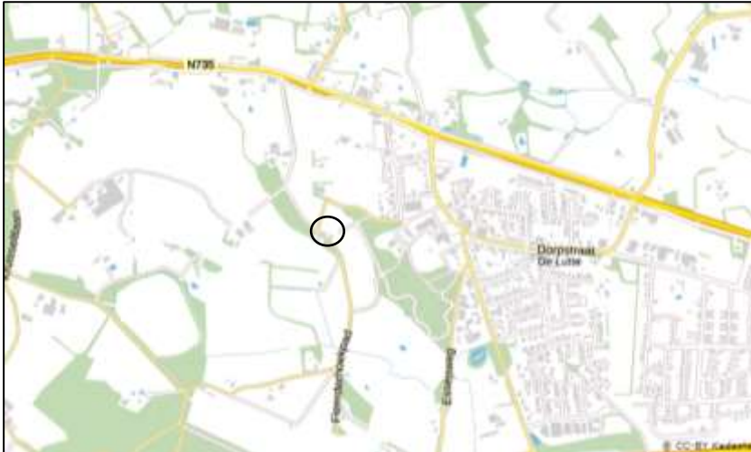
Globale ligging van het plangebied. De ligging van het plangebied wordt met de cirkel aangeduid (bron kaart: PDOK).

Het plangebied is gesitueerd aan de Bavelweg 2 in De Lutte. Het plangebied ligt in het buitengebied ten westen van de woonkern De Lutte en ligt in een kleinschalig en bosrijk agrarisch cultuurlandschap. Het plangebied wordt aan alle zijden omringd door landbouwgrond. Op onderstaande afbeelding wordt de globale ligging van het plangebied weergegeven op een topografische kaart.