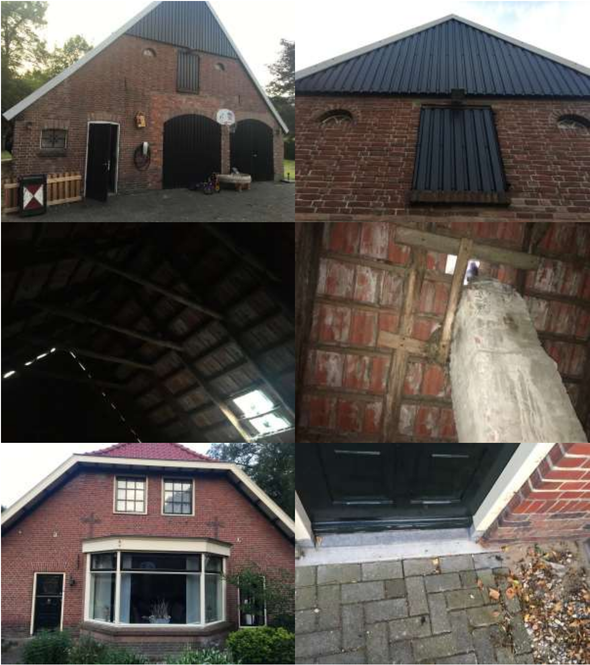
Bijlage 3. Fotobijlage. Impressie van het plangebied en de directe omgeving.