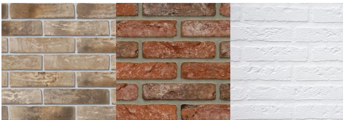
Bruin-rode baksteen of wit gekeimde baksteen