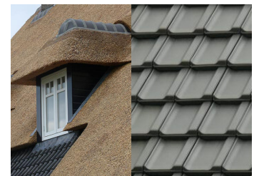
Rieten kap, keramische zwarte dakpan