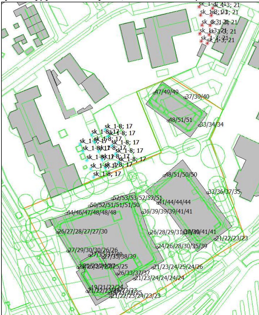
Figuur 5.1: Langtijdgemiddelde beoordelingsniveaus; Aldetienstraat 17 De Sterrenkijker

In figuur 5.1 en 5.2 is de nummering van de toetspunten gegeven alsmede de langtijdgemiddelde beoordelingsniveaus op de gevels op de verschillende hoogtes ten gevolge van de Aldetienstraat 17 en 21A. Tevens is in figuur 5.3 de gecumuleerde geluidbelasting van beide scholen gegeven.