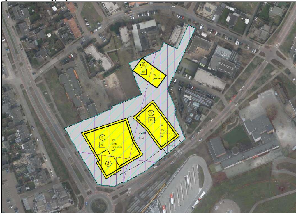
Figuur 2.3: Verbeelding plangebied

In figuur 2.3 is de verbeelding van het plangebied weergegeven.