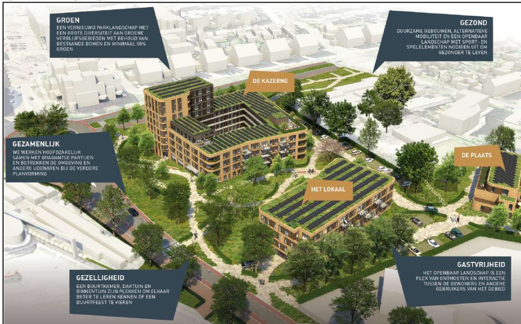
Figuur 2.2: Indeling plangebied

In figuur 2.3 is de verbeelding van het plangebied weergegeven.