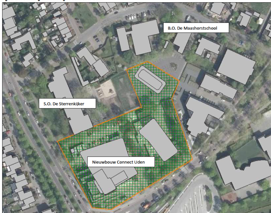
Figuur 2.1: Situering ontwikkeling vs scholen te Uden

In figuur 2.1 is de ligging van het plangebied ten opzichte van de 2 scholen weergegeven.