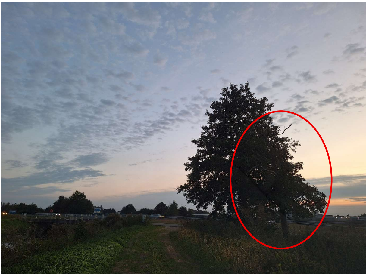
Afbeelding 2: Impressie locatie: Oude Vaart met zandpad (foto boven) en de onderzochte zwarte els (foto onder).