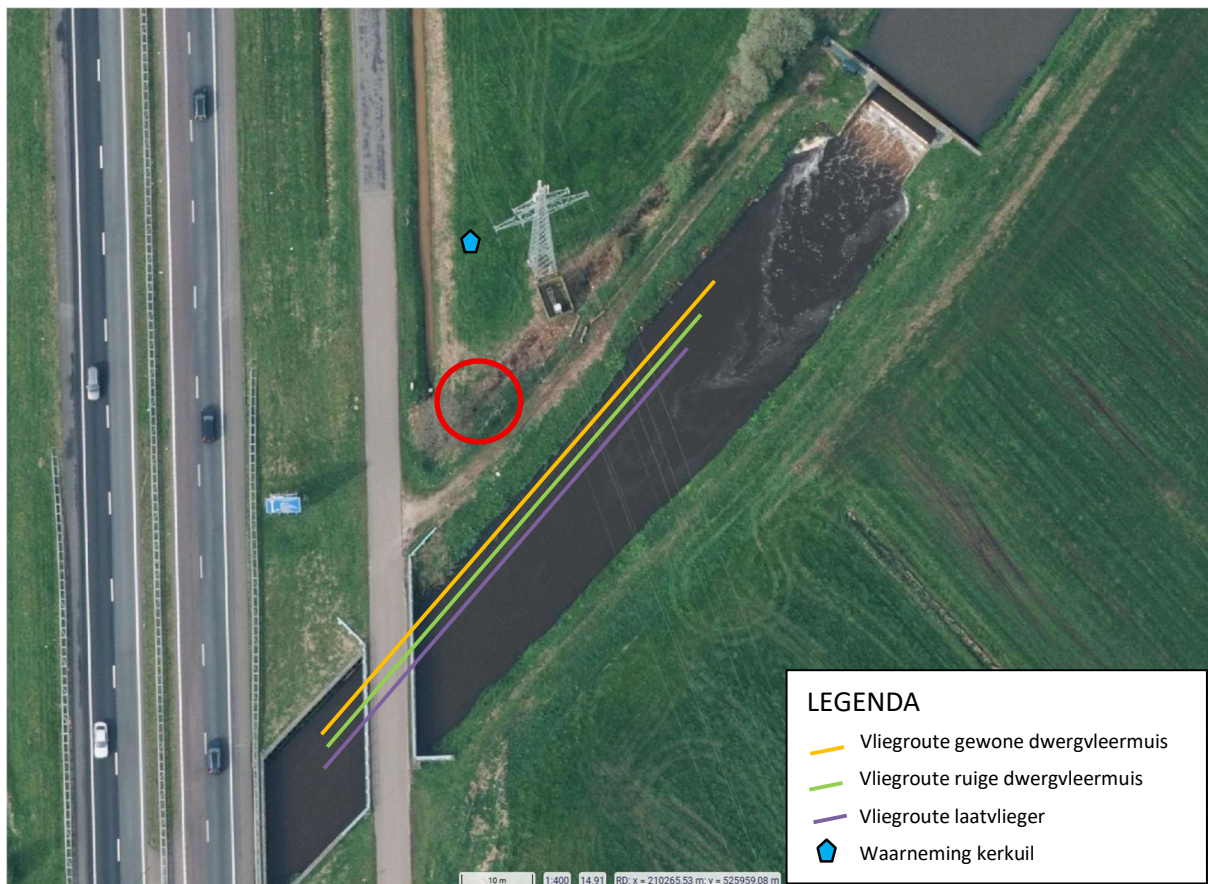
Afbeelding 3: Resultaten vleermuisonderzoek met rood omcirkeld de onderzochte boom met holtes

Vliegroute en foerageergebied: De oever van de Oude Vaart wordt gebruikt als vliegroute en af en toe wordt er gejaagd boven de Oude Vaart. De zwarte elzen maken geen onderdeel uit van een essentiële vliegroute. Ook is geen sprake van een essentieel foerageergebied.