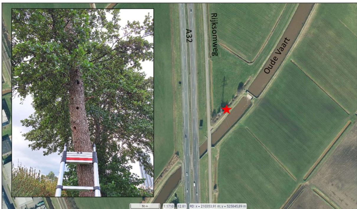
Afbeelding 1: Impressie boom en locatie (bron: PDOK viewer, luchtfoto 2024 met locatieaanduiding boom met een rode ster)

Wanneer de uitvoering van de werkzaamheden plaats gaat vinden is momenteel niet bekend.