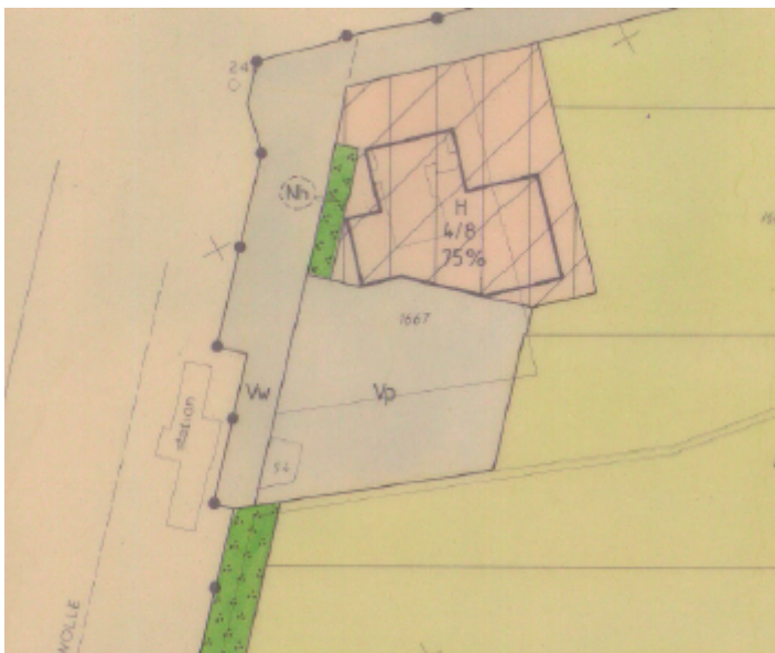
Fragment verbeelding bestemmingsplan "Husselerveld".

Gelet op de specifieke bestemmingsomschrijving zijn fietsparkeervoorzieningen in de vorm van overdekte rijwielstallingen niet toegestaan.