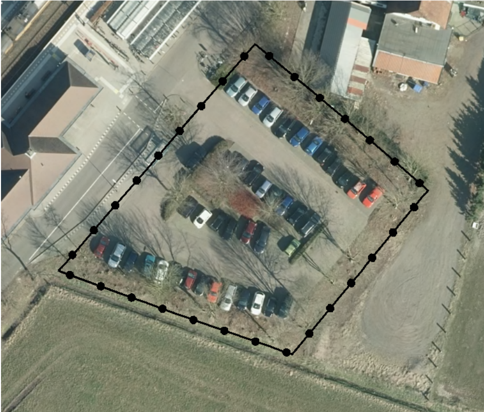
Gebied van de beheersverordening.