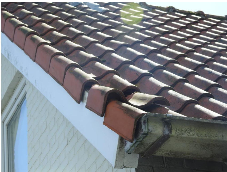
Foto 3. Overzicht bebouwing.