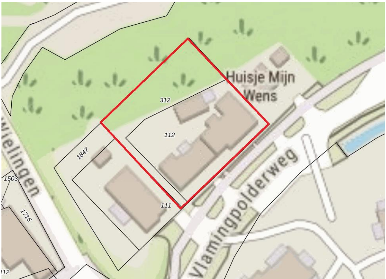
Figuur 1. Plangebied (rood).

Het plangebied is weergegeven in figuur 1. Het plangebied is het gebied waar de werkzaamheden zullen plaatsvinden (rood aangegeven).