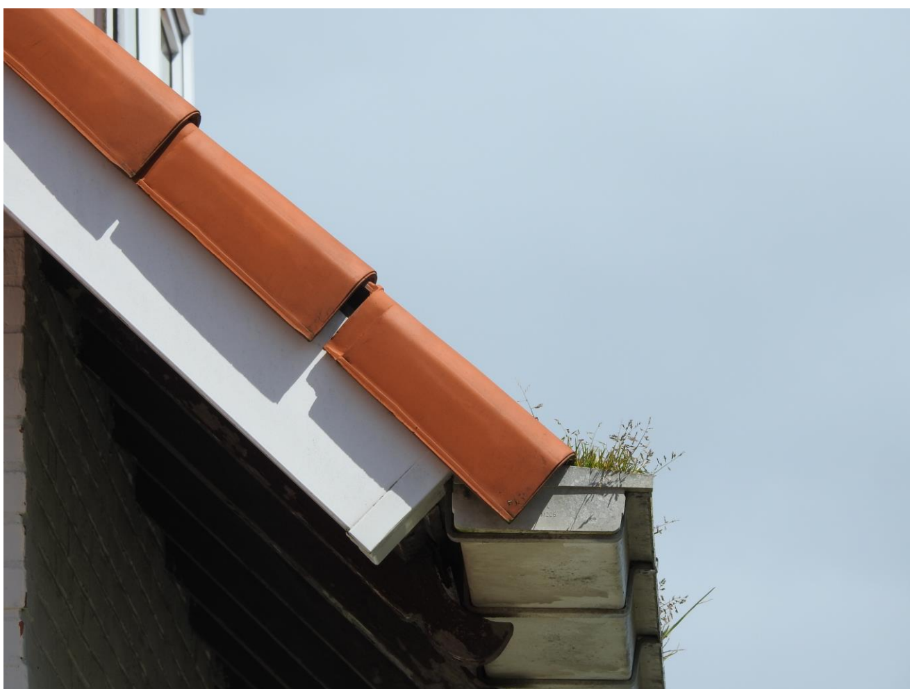
Foto 1. Kierende dakpannen, mogelijkheden voor vleermuizen.

De geplande werkzaamheden bestaan uit het slopen van de bebouwing en het ruimen van de tuin, het verwijderen van duinstruweel.