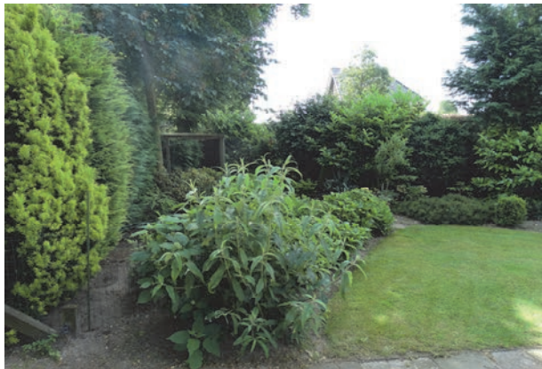
Figuur 5: Aanzicht siertuin