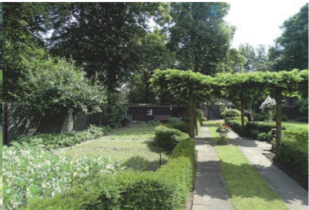
Figuur 6: Aanzicht moestuin (links) en wandelpad binnen de siertuin