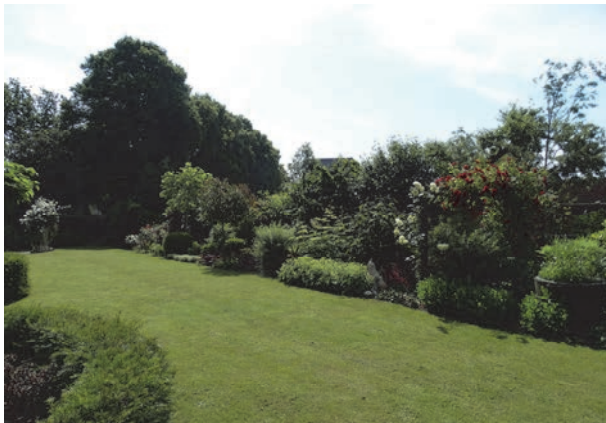
Figuur 3: Aanzicht siertuin en grasveld

Het plangebied bestaat uit een siertuin met grasveld, moestuin, een kippenhok, een houten schuurtje met bestrating en een drietal bomen. De bomen zijn geplant aan de rand het perceel nabij de slootkant die het perceel scheidt met de Brederodeweg. De volgende afbeeldingen (figuur 3 t/m 6) geven een impressie van het plangebied en de directe omgeving.