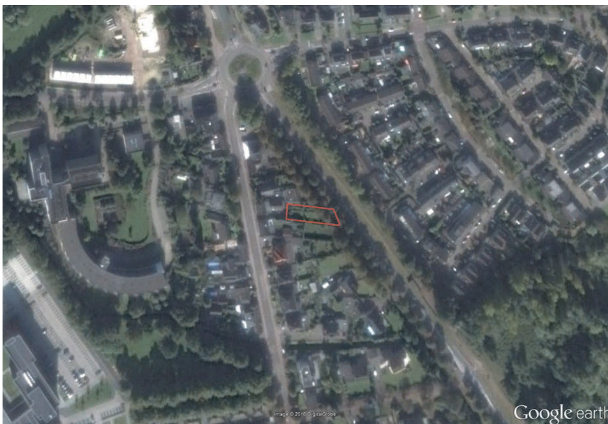
Figuur 1: Luchtfoto plangebied

Het plangebied bevindt zich aan de Bosscheweg 46 te Boxtel, gemeente Boxtel. De Amersfoortcoördinaten van het midden van het plangebied zijn X= 150,652 , Y= 400,738 . Het plangebied is rood omkaderd weergegeven op de luchtfoto (figuur 1) en weergegeven als een rode ster op de topografische kaart (figuur 2).