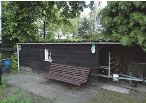
Figuur 4: Aanzicht te slopen houten schuurtje