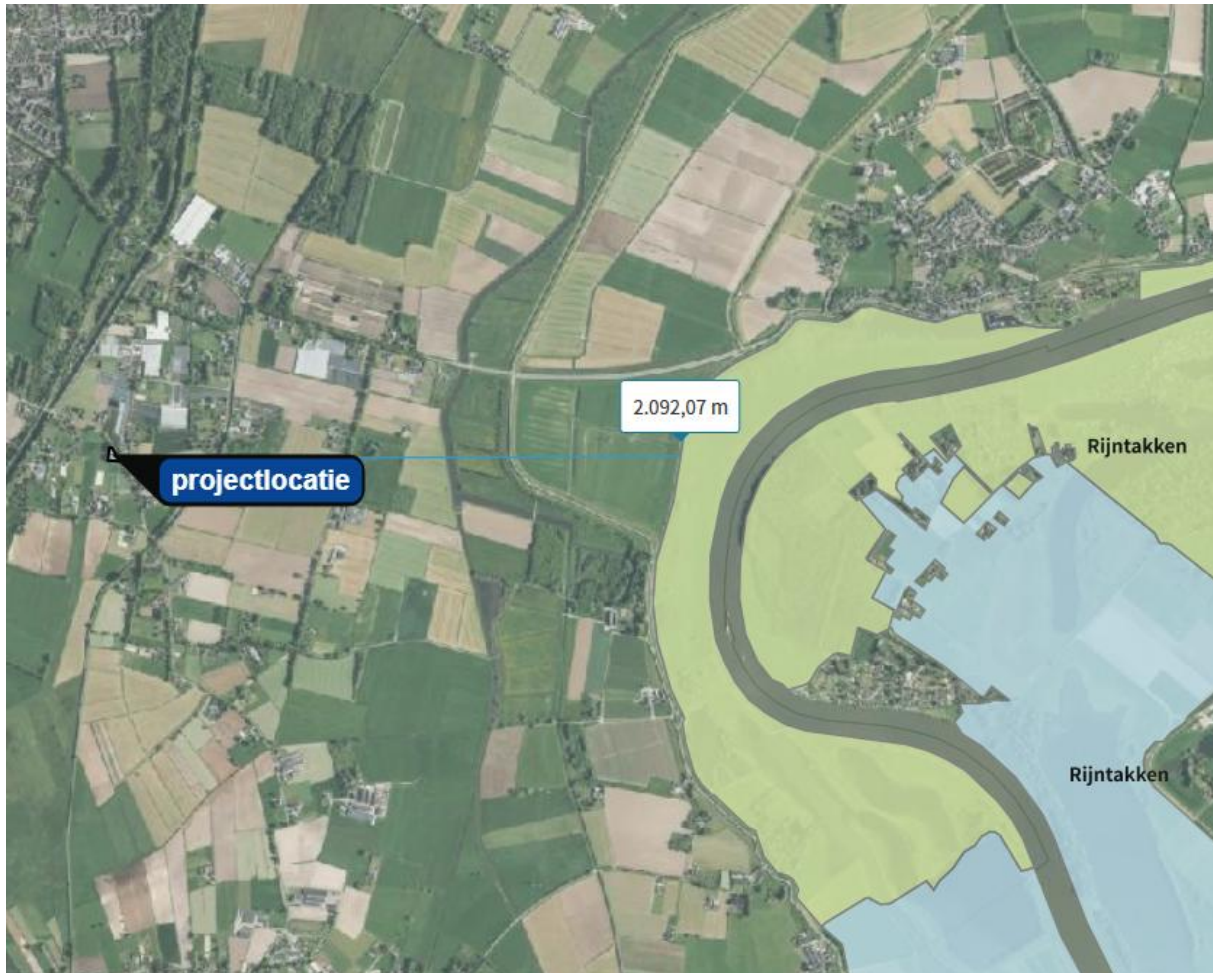
Figuur 1.2 Omliggende Natura 2000-gebieden