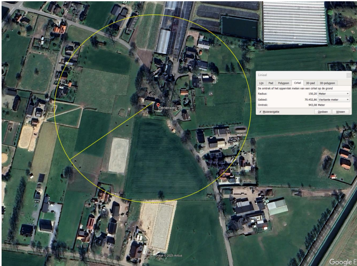
Afbeelding 9 Binnen een straal van 150 meter om de projectlocatie is de omgeving beschouwd op mogelijke geuroverlast veroorzakende activiteiten en bedrijvigheid (Google Earth, 2025).

De kwaliteit van het woon- en leefklimaat met betrekking tot geluid is bevestigd door de uitgevoerde geluidonderzoeken zoals beschreven in paragraaf 4.6. In paragraaf 4.8 wordt het aspect geur nader beschouwd.