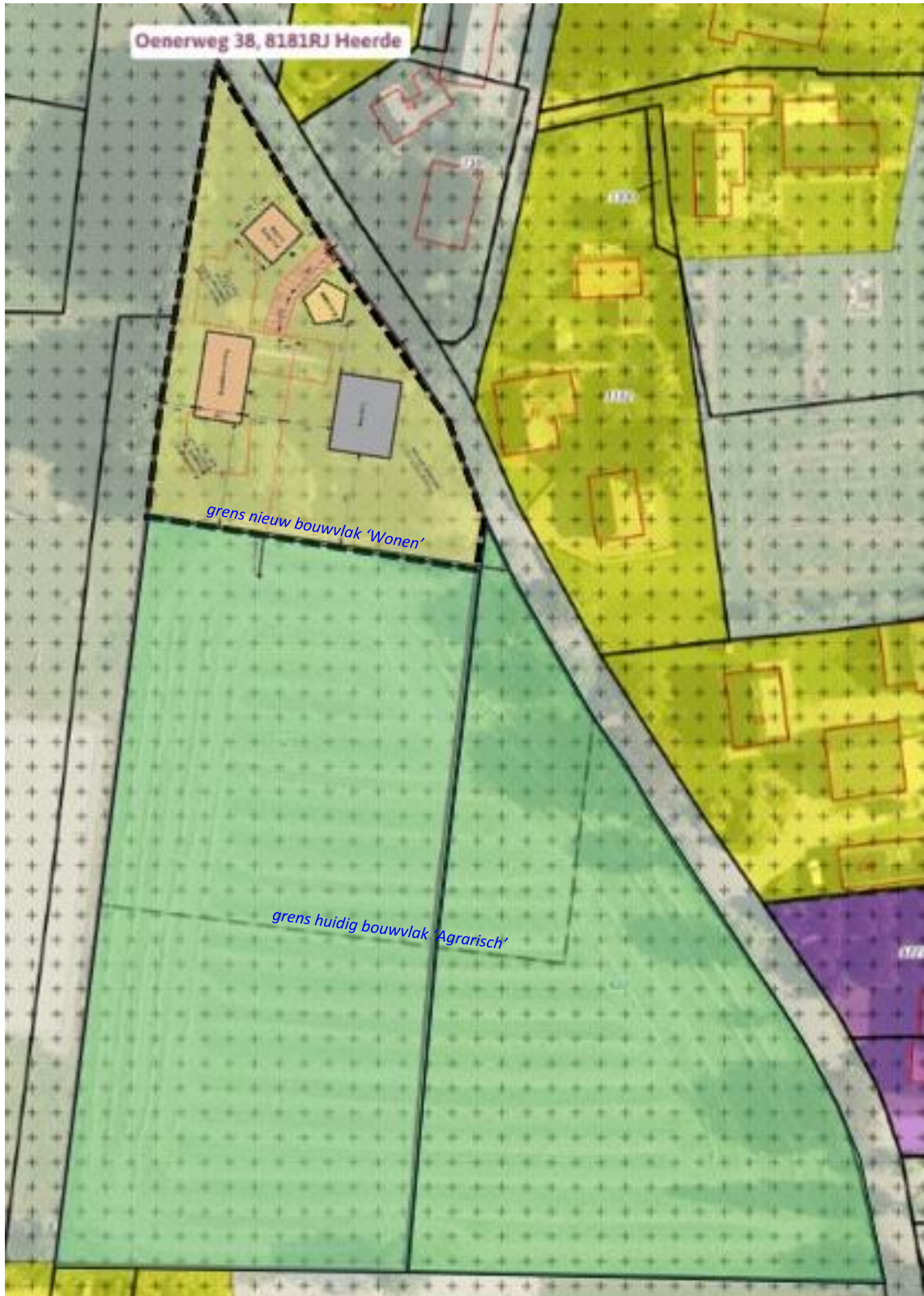
Afbeelding 5 Voorstel wijziging bouwvlak en functiewijziging van percelen Heerde P522 en P523 van 'Agrarisch' naar 'Wonen' (Omgevingswet.overheid.nl).