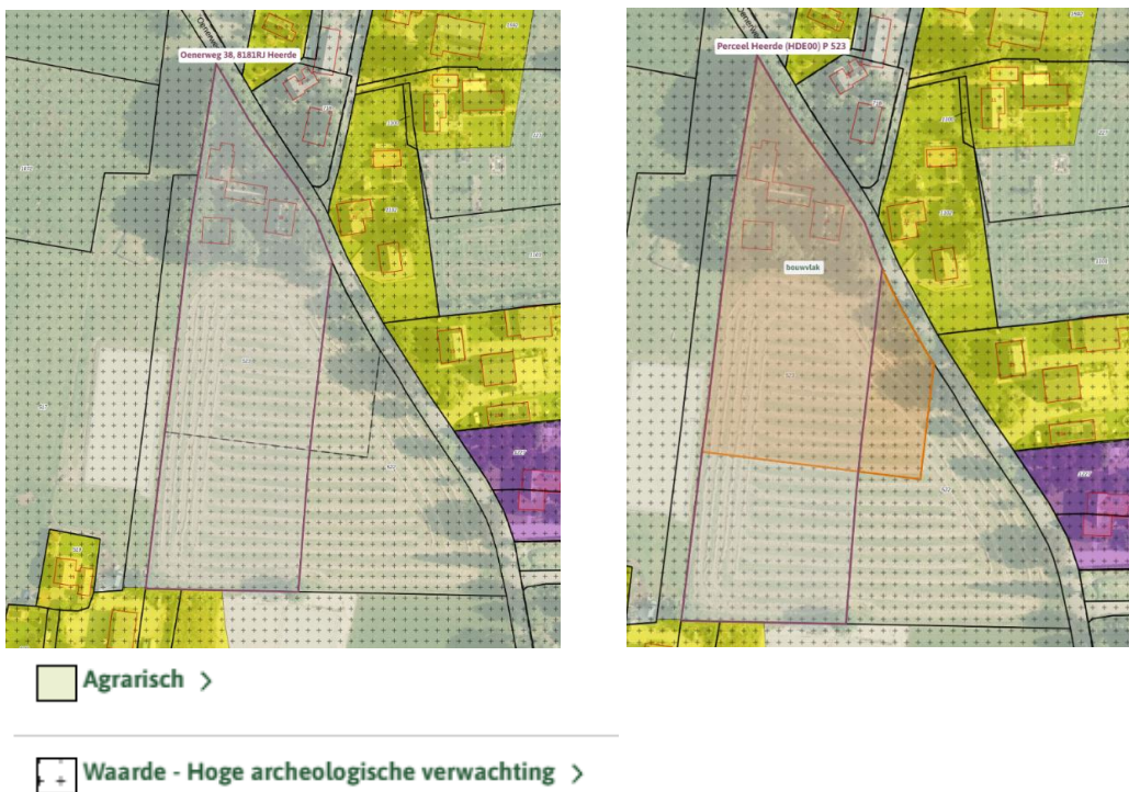
Afbeelding 2 Uitsnedes van het plangebied uit het bestemmingsplan 'Buitengebied West'. Het erf is aangewezen voor de functie 'Agrarisch' en 'Waarde - Hoge archeologische verwachting'. Rechts is in oranje het bouwvlak weergegeven (Omgevingswet.overheid.nl).