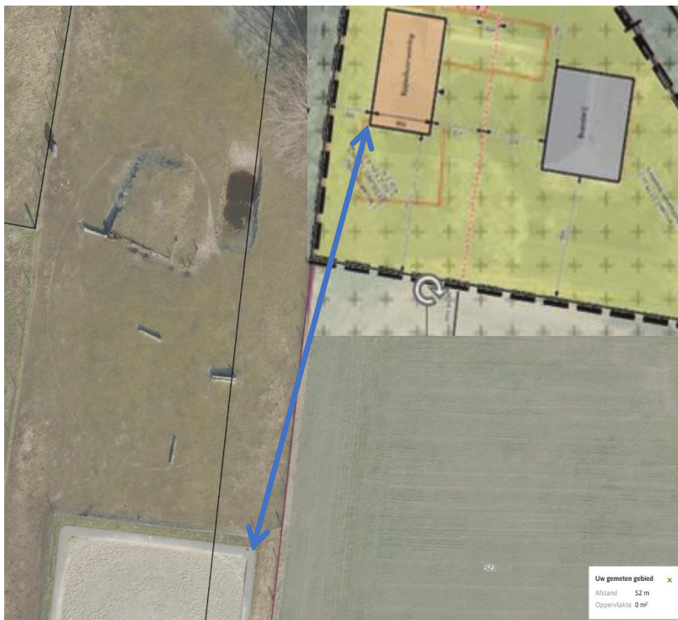
Afbeelding 10 De afstand tussen de paardenbak en de nieuw te bouwen kapschuurwoning is ruim 50 meter.

Met betrekking tot activiteiten en milieuzonering is in het onderhavige initiatief sprake van een evenwichtige toedeling van functies aan locaties.