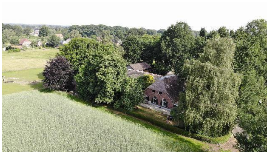
Bovenaanzichten vanuit zuidoostelijke richting

Sommige opstallen zijn voorzien van asbesthoudende dakbedekking. Een kwalitatief goede en duurzame herontwikkeling is nodig om de locatie toekomstbestendig te maken en verder verval te voorkomen. Ook in de eigenlijke boerderij - zonder monumentale status - dient grondig te worden geïnvesteerd om die als beeldbepalend object op het erf te behouden. De boerderij met woning en deel voldoet ten aanzien van een goed woon- en leefklimaat niet aan de huidige eisen en wensen. Zo zijn de kapconstructie en rieten dakbedekking bijna aan het einde van hun economische levensduur. Isolatie ontbreekt en er wordt nog gebruik gemaakt van gaskachels. Het erf is momenteel voorzien van tenminste vier in- en uitritten van en naar de Oenerweg. Met onderstaande foto's wordt een impressie gegeven van de huidige situatie.