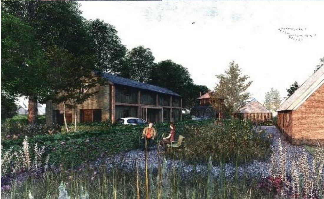
Sfeerimpressies erfinrichting (R. van Vemde).