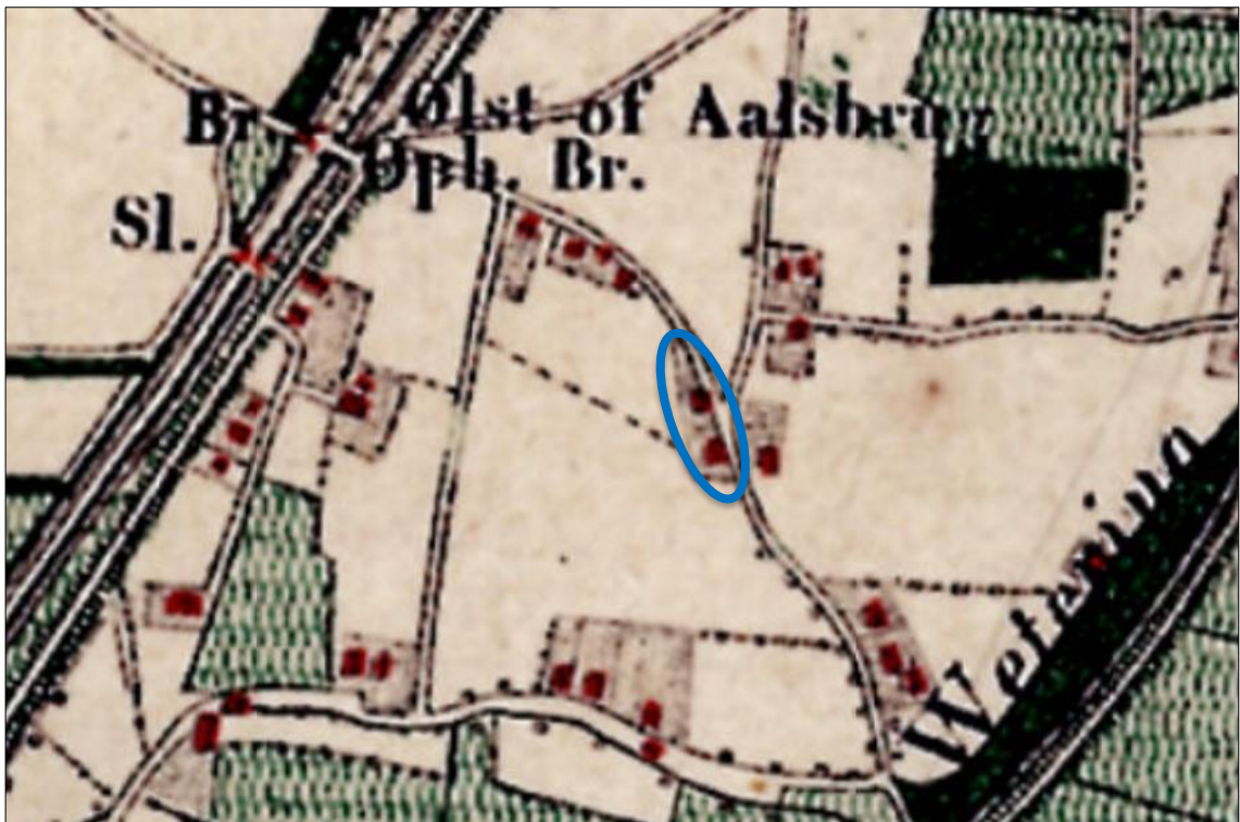
Afbeelding 3 Historisch kaartbeeld rond 1870 van de projectlocatie Oenerweg 38 (Topotijdreis.nl).

Hoewel de woonbebouwing in de buurtschap Markluiden in de loop van de tijd wat meer is geclusterd, heeft het de afgelopen decennia geen spectaculaire bewoningsontwikkeling doorgemaakt, maar is die in beperkte mate organisch gegroeid. Op het historische kaartbeeld van 1866 is op de huidige projectlocatie - in onderstaande afbeelding blauw omlijnd - voor het eerst bebouwing zichtbaar in de vorm van twee bouwvolumes. Rond de jaren '20 van de vorige eeuw is één bouwvolume op het erf zichtbaar. Vanaf de jaren '60 van de vorige eeuw neemt het aantal bouwvolumes weer toe tot het huidige aanwezige aantal.