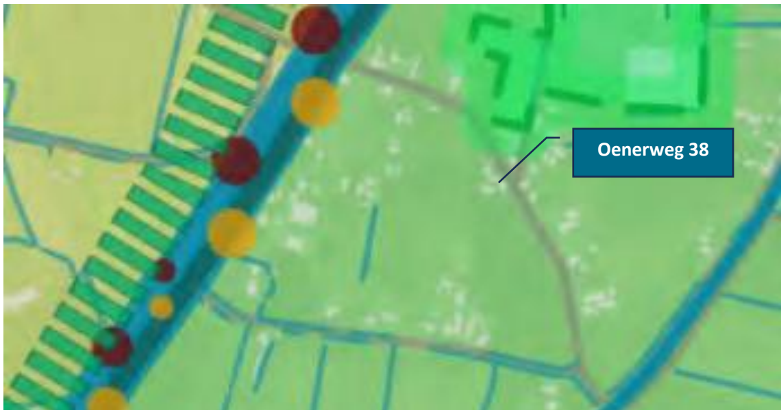
Afbeelding 8: Uitsnede Kaart Omgevingsvisie Heerde met de ligging van de projectlocatie in zone 3; deelgebied 'Weteringengebied' ( Heerde.nl/Ondernemers/Beleid_en_regelgeving/Omgevingsvisie ).

Ten aanzien van punt 4 ' samen en in overleg ' wordt verwezen naar paragraaf 6.2 en bijlage 8 van deze toelichting waarin het participatieproces wordt beschreven.