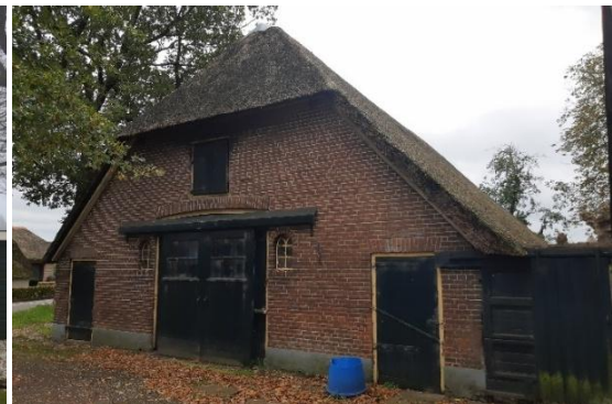
Achterzijde gezien vanaf de Oenerweg