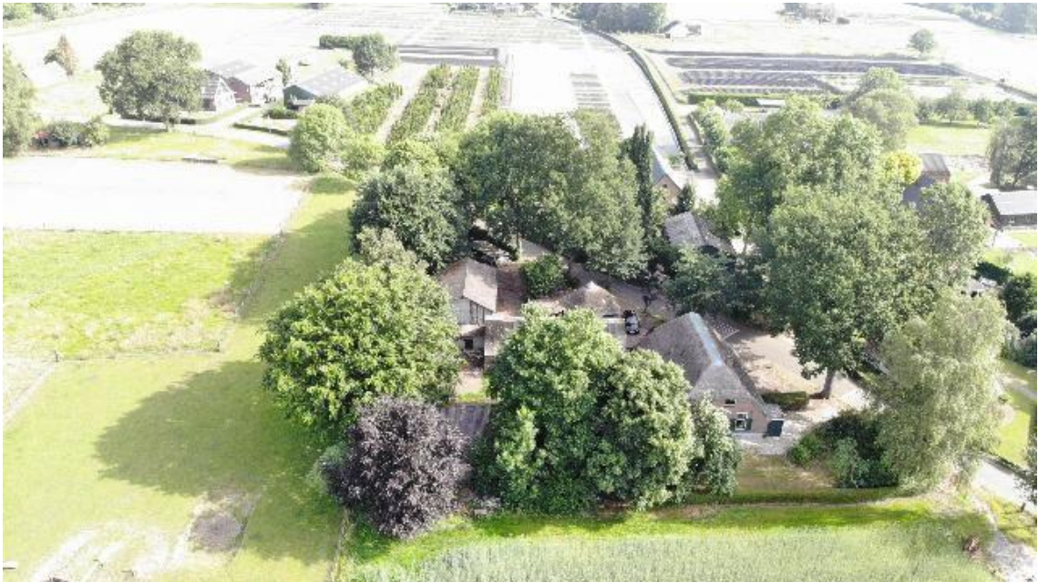
Afbeelding 6 De ontwikkeling van het nieuwe erf zal zoveel mogelijk plaatsvinden binnen het bestaande groene kader van het erf (Fam. Van Lohuizen).

Ten aanzien van de groene erfinrichting is het - naar uitdrukkelijke wens van de erfgenamen en tevens initiatiefnemers - de intentie om zoveel mogelijk van de huidige groene opstanden te behouden. Met het oog op verkeersveiligheid, bodemsanering, onderhoud en/of ziekte van bomen kan echter niet voorkomen worden dat enkele groenopstanden worden verwijderd. Waar nodig wordt daar een (kap)vergunning voor aangevraagd.