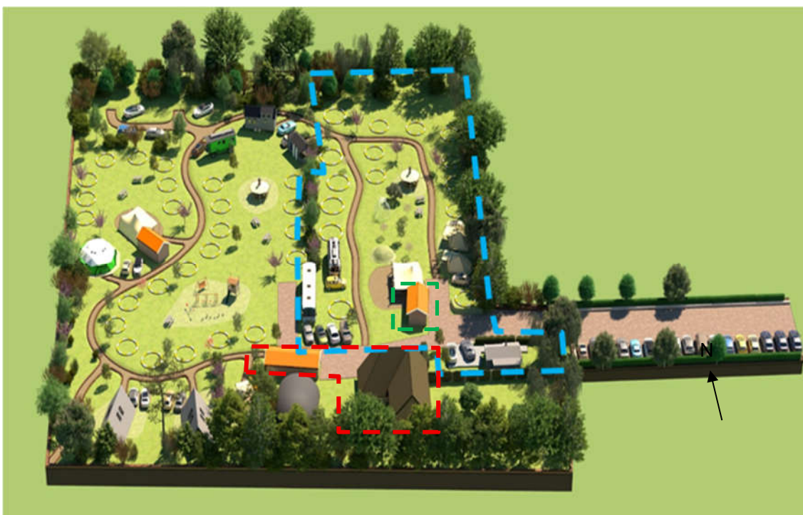
Afbeelding 2.1: Ontwerpschets met bestaande camping binnen blauwe stippellijn, bestaande woning en schuur binnen rode stippellijn, bestaand sanitairgebouw binnen groene stippellijn

De uitbreiding vindt plaats aan de oostzijde. Het veld met de huidige kampeerplekken zal gehandhaafd blijven maar wordt aangevuld met een grindpad in de vorm van een karrenspoor over het veld. Dit pad zal slingerend worden voortgezet over de rest van het terrein langs de nieuwe kampeerplaatsen en accommodaties. Langs de zuidgrens wordt beplanting toegevoegd in de vorm van inheems struweel/heesters, waarbij de soorten geselecteerd zijn op hun toegevoegde waarden voor bijen en als voedsel en nestlocaties voor vogels. De accommodaties in de vorm van A-frame vakantiewoningen zijn aan de noordelijke grens voorzien, grenzend aan campingpark Zeezicht.