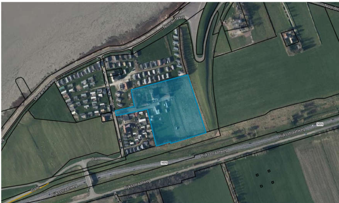
Afbeelding 1.1: Ligging projectgebied op luchtfoto

De locatie is gelegen op een locatie tussen de rijksweg N99 en de Waddenzee. Op deze locatie zijn meerdere campings aanwezig. Het projectgebied is op afbeelding 1.1 blauw gearceerd.