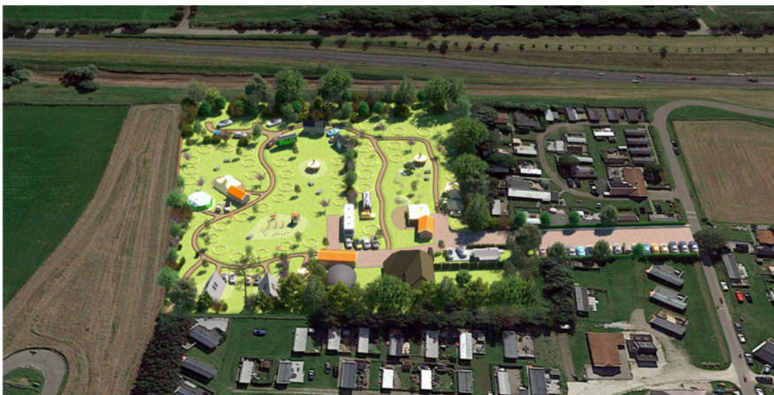
Afbeelding 2.2: Ontwerpschets (vogelvlucht vanaf noordzijde)

de kampeerplekken waarbij schaduw wordt gecreëerd. In het beeldkwaliteitsplan is een nadere toelichting gegeven op de inrichting 1 .