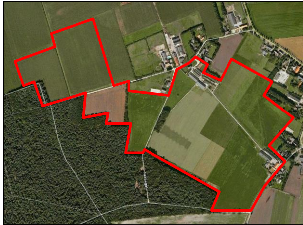
Afbeelding 1: globale ligging plangebied