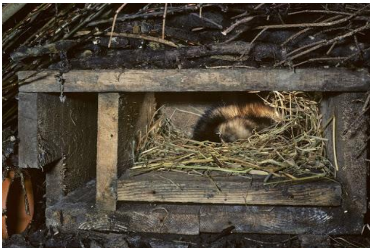
Afbeelding 6.1: Voorbeeld van een nestkast binnenin een marterhoop.