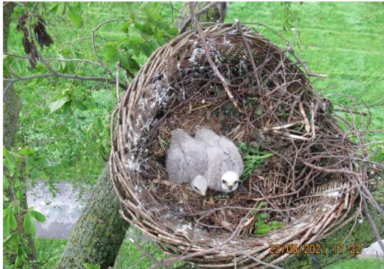
Bewoning door buizerd in 2021