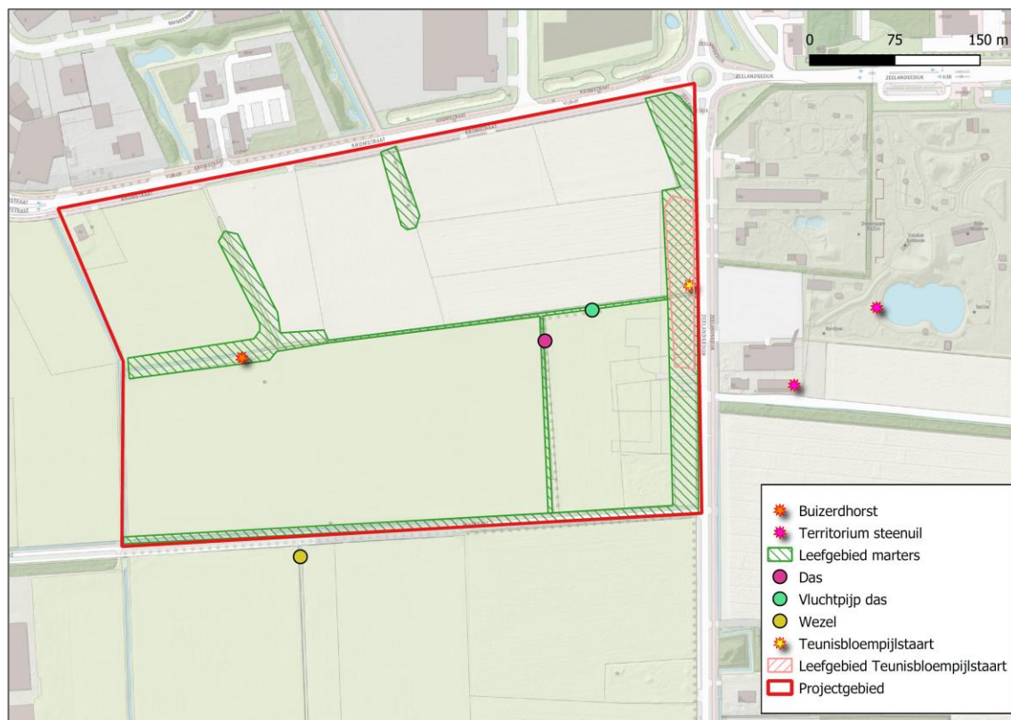
Afbeelding 4.1 resultaten aanvullend onderzoek

Onderstaande afbeelding geeft een totaaloverzicht van de resultaten van het aanvullend onderzoek.