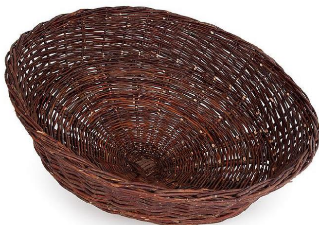
Figuur 1. Nestmand RB BU 01

Alhoewel de buizerd Buteo buteo prima in staat is zelf een nieuw nest te maken wordt in de praktijk wel eens een kunstnest aangeboden. Dit is vooral het geval bij het ontbreken van oude kraaiennesten. Idverde Advies heeft Buijs Eco Consult gevraagd naar ervaringen met het toepassen van kunstnesten als mitigerende maatregel voor de buizerd. Buijs Eco Consult heeft enige ervaring met het type kunstnest RK BU 01 ( RK BU 01 Nestmand Buizerd | Vivara Pro ) zie figuur 1. Deze memo beschrijft de toepassingen en effectiviteit van door Buijs Eco Consult aangebrachte kunstnesten.