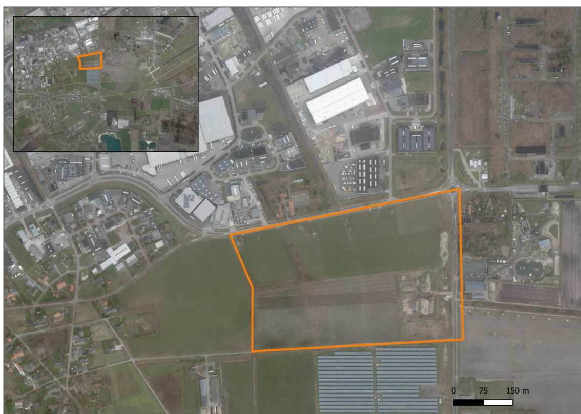
Afbeelding 1.1 Het plangebied (oranje omkaderd) aan de Venstraat te Uden.

Voor het uitvoeren van ruimtelijke ingrepen en ontwikkelingen, verplicht de Wet natuurbescherming de bestaande natuurwaarden in kaart te brengen en indien nodig passende maatregelen te treffen voor het beschermen en in stand houden van bij wet beschermde soorten. Om deze reden is een ecologisch onderzoek uitgevoerd. Het plangebied is door idverde Advies onderzocht en beoordeeld op de aanwezigheid van en betekenis voor beschermde planten- en diersoorten (idverde Advies, rapportnummer 722220024). Uit aanvullend onderzoek is gebleken dat het plangebied functioneel leefgebied betreft voor de aanwezige buizerd, steenuil, wezel, steenmarter en das. Omdat de voorgenomen ontwikkeling invloed heeft op het voorkomen van genoemde soorten, wordt ontheffing gevraagd in het kader van de Wet natuurbescherming middels dit activiteitenplan.