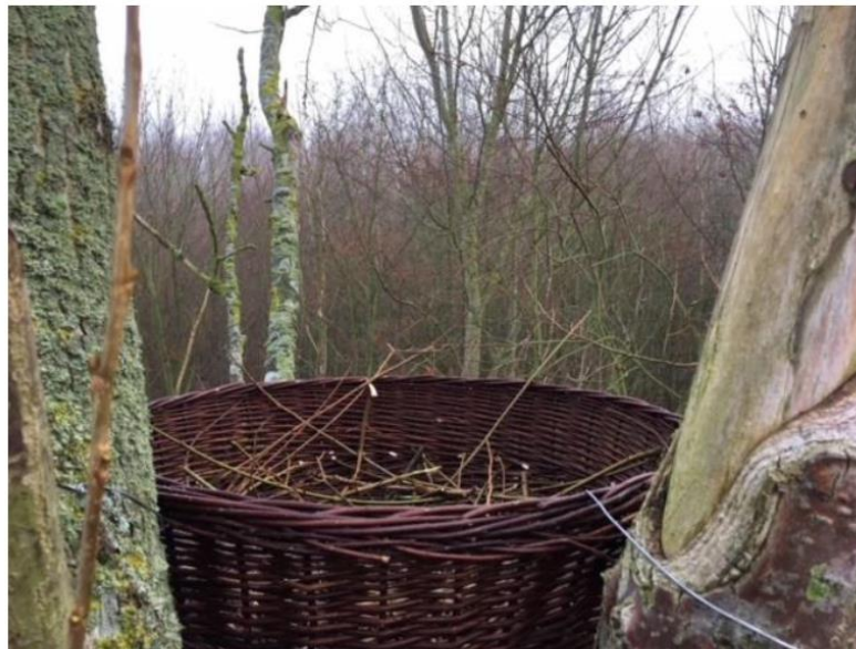
Na plaatsing 2017

In 2017 zijn 2 manden opgehangen als alternatief voor havik, in 2019, 2020 en 2021 nest bewoond door buizerd. Mand was scheef gewaaid maar buizerd heeft nest zelf horizontaal gebouwd. Takken van populier aangebracht waren als substraat in de mand aangebracht bij plaatsing.