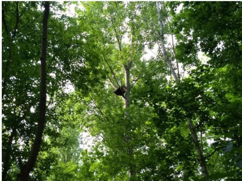
Bewoning door buizerd in 2021