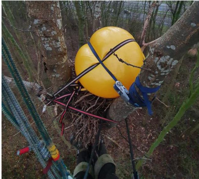
Tijdelijk ongeschikt gemaakt nest

Voor de aanleg van een hoogspanningsmast is in 2020 een horstboom (tijdelijk) ongeschikt gemaakt door aanbrengen skippybal. In voorjaar 2021 is nestbouw en broeden vastgesteld in 1 van de aangebrachte kunstnesten binnen 100 meter van ongeschikt gemaakte nestboom. Als broedsubstraat cacaooppotten en takken aangebracht. Kunstnest was ook in 2022 in gebruik door buizerd paar.