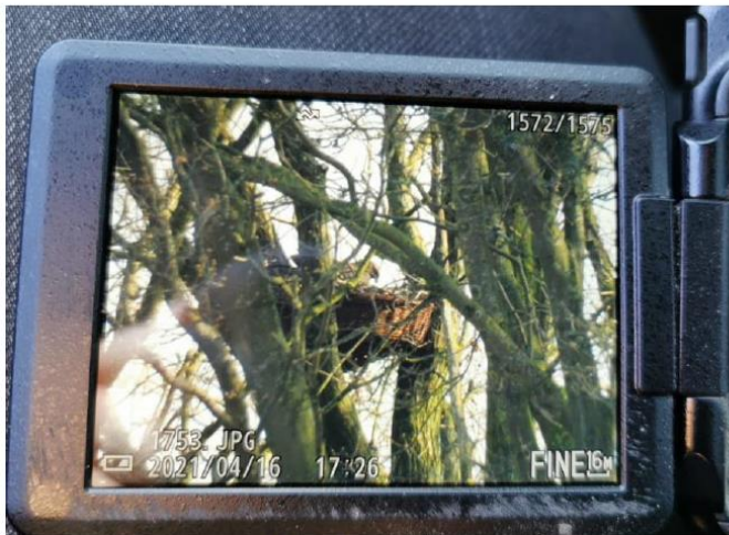
Buizerd op kunstnest april 2021