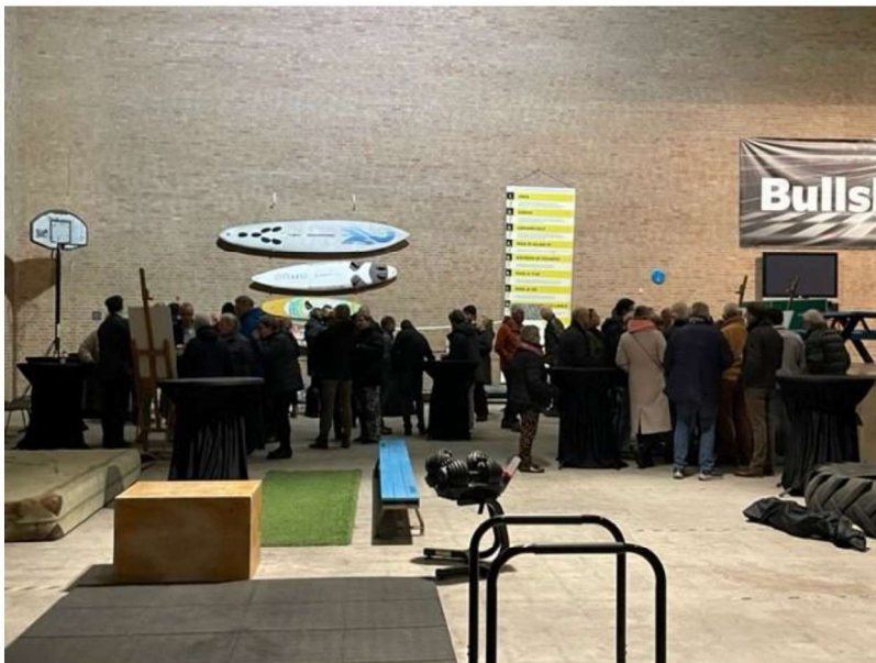
Afbeelding 1 Omgevingsdialoog