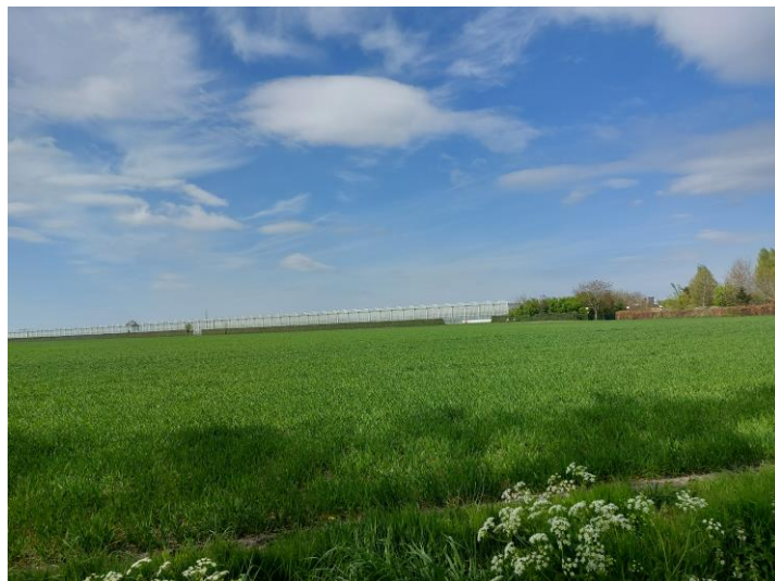
Foto's locatie gaslong