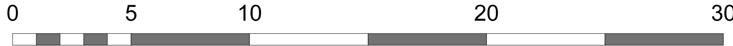
Situatietekening schaal 1:100