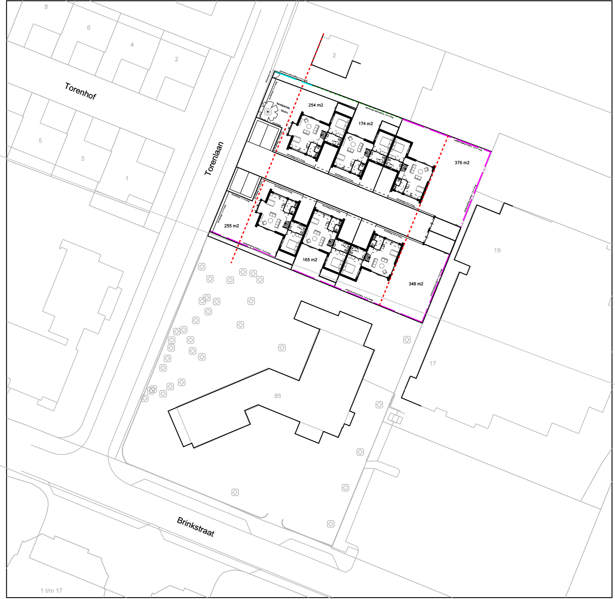
Situatietekening schaal 1:500