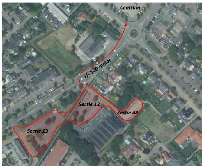
Figuur 5.1: Locatie secties 12, 13 en 48 t.o.v. centrum

Het merendeel van de functies uit tabel 5.1 zijn voorzien in het centrum van Berlicum. Daarom wordt uitgegaan van de minimale acceptabele loopafstand van alle functies samen, dit is 100 meter. Als gekeken wordt in een straal van +/- 100 meter buiten het centrum dan zijn de parkeerterreinen in secties 12, 13 en 48 nabij sporthal 'De Run' geschikte locaties om een deel van de parkeerbehoefte van het centrum op te vangen, zie figuur 5.1.