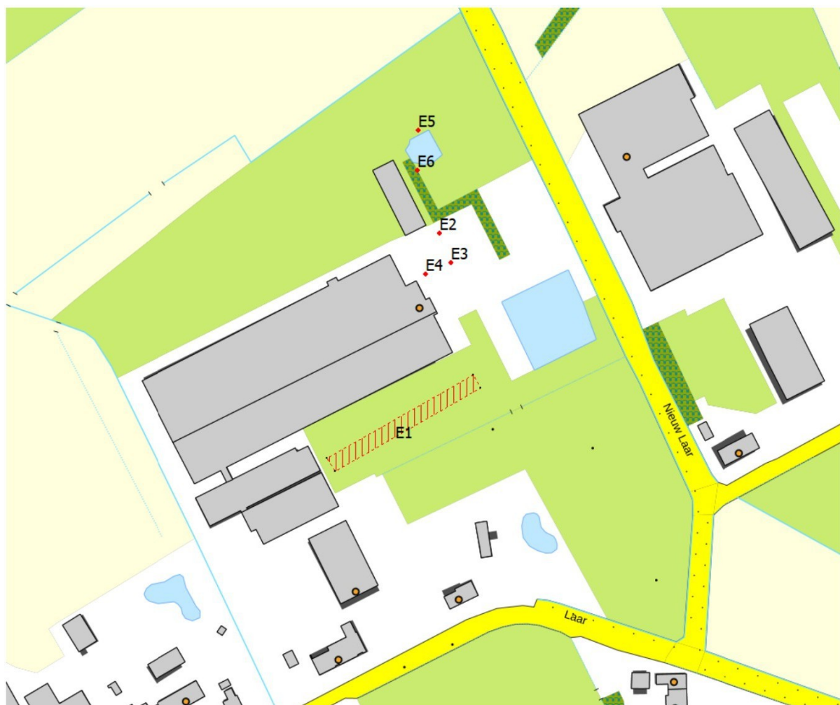
Figuur A.1 Overzichtskartaal met emissielocaties (E1 t/m E6) binnen de inrichting in de vergunde en aangevraagde situatie.