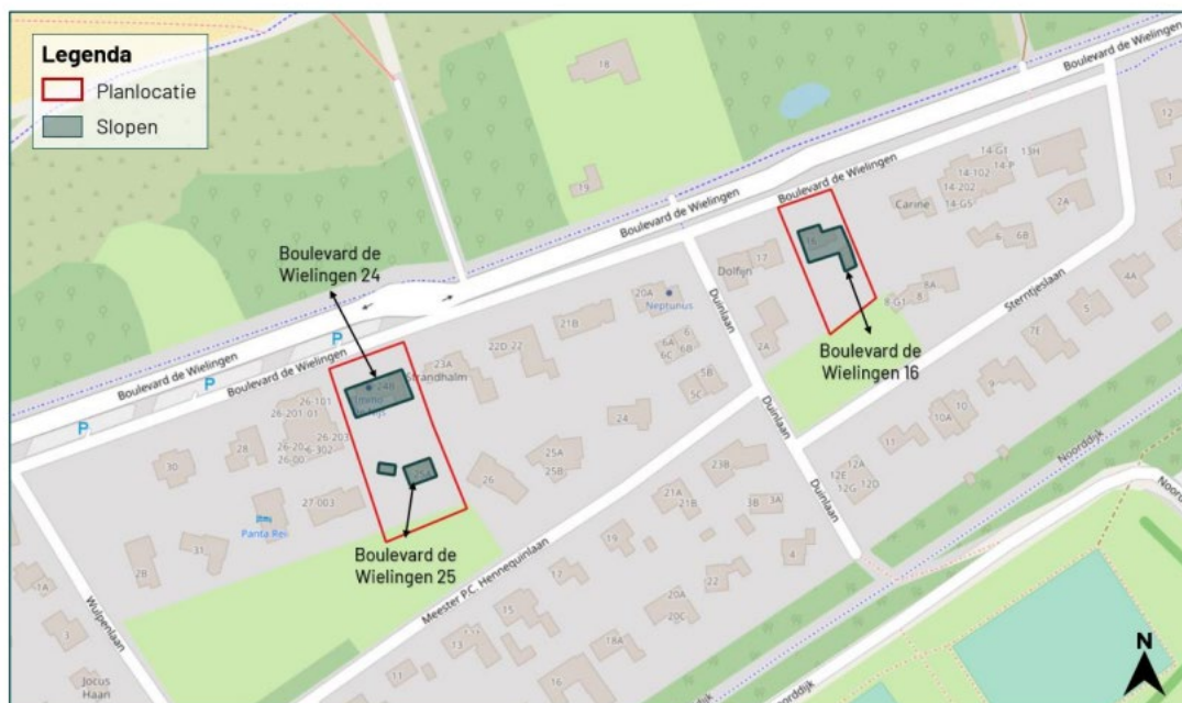
Figuur 1 - De planlocaties (rood omkaderd) zijn gelegen aan de Boulevard de Wielingen 16, 24 en 25 te Cadzand-Bad.