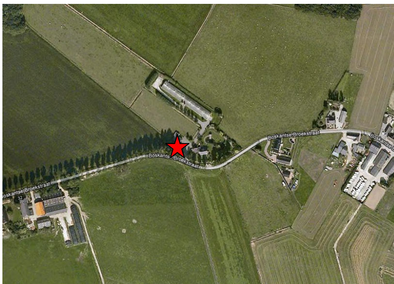
Luchtfoto met globaal de ligging van het plangebied)

Voorliggende onderbouwing is opgesteld ten behoeve van een buitenplanse omgevingsvergunning (projectafwijkingsbesluit) voor de realisatie van een wegkapel op een locatie aan de Boskantse Broekstraat, in de gemeente Wijchen.