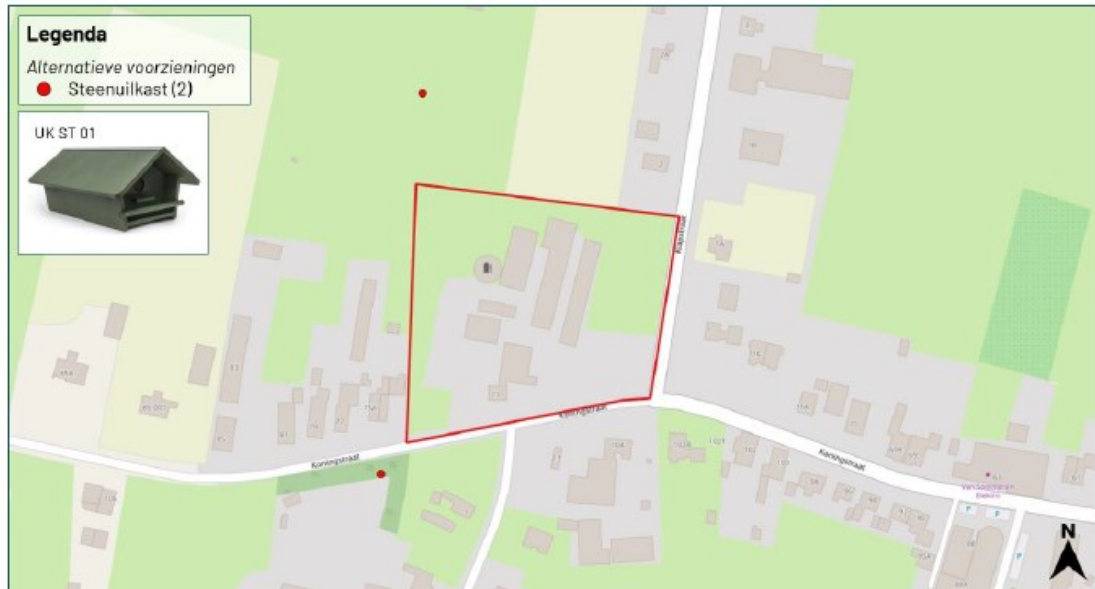
Figuur 5: Locatie mitigerende maatregelen steenuil