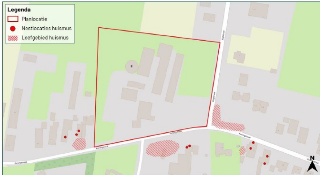
Figuur 7: Resultaten huismus onderzoek