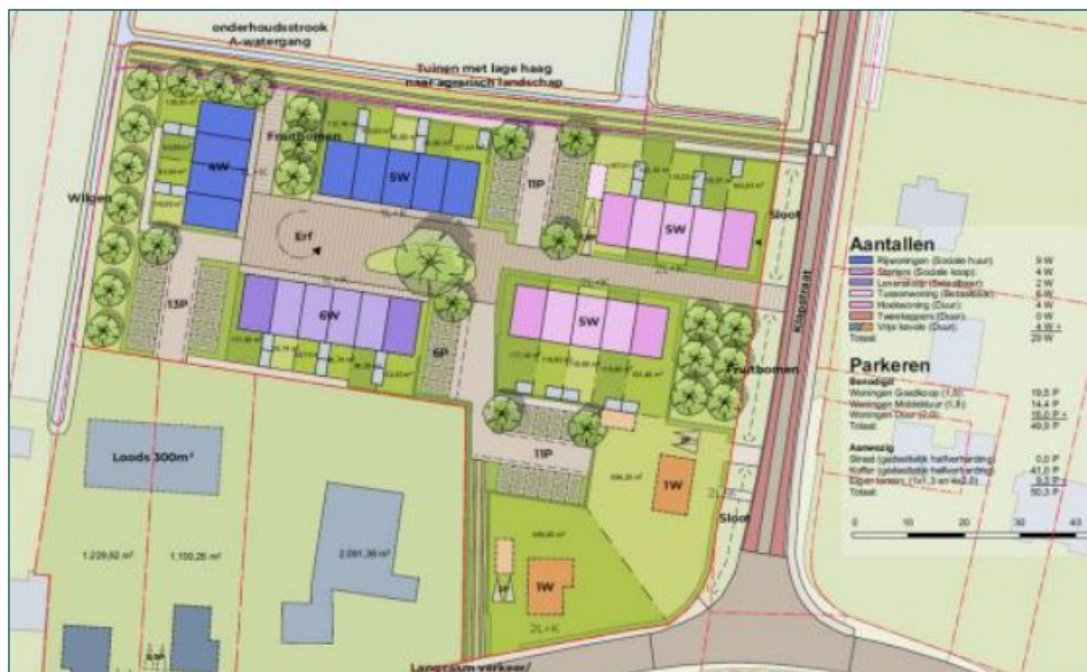
Figuur 2: Beoogde ontwikkeling op de planlocatie