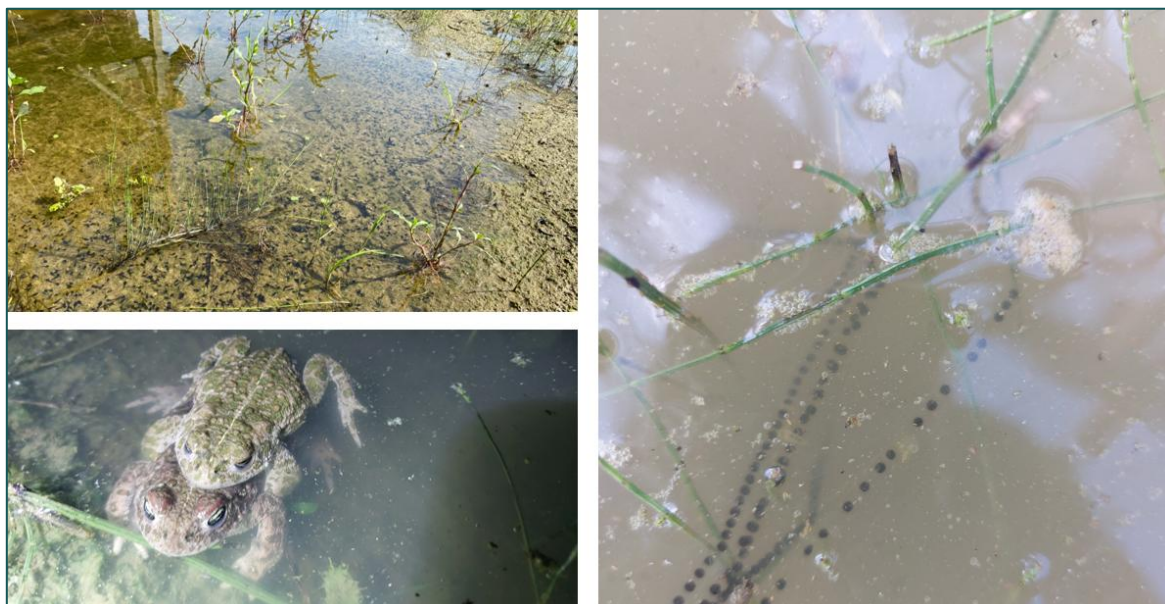
Figuur 3.5 Aangetroffen rugstreeppadden tijdens het onderzoek. Deze zijn voornamelijk aangetroffen bij een grotere pool onder de machine structuur.