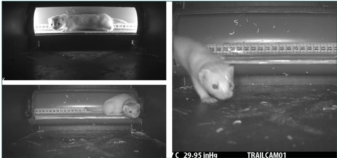
Figuur 3.4 Waargenomen wezel in marterbox 52 op de planlocatie. Wegens de infrequente waarnemingen en afwezigheid van sporen binnen de planlocatie leidt de beoogde ontwikkeling niet tot aantasting van essentieel leefgebied van kleine marterachtigen en steenmarter.