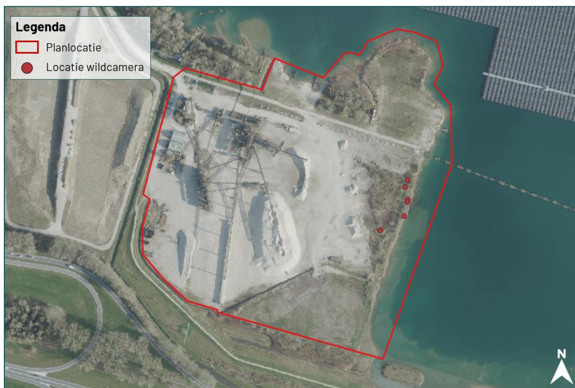
Figuur 2.1 Voor het aanvullend onderzoek naar de bever is er gebruik gemaakt van drie cameravallen, deze zijn gedurende het onderzoek verplaatst.

Ter ondersteuning van de veldwaarnemingen zijn daarnaast drie cameravallen ingezet om eventuele individuen vast te leggen. Deze cameravallen zijn gedurende de onderzoeksperiode strategisch verplaatst om een groter deel van het onderzoeksgebied te monitoren (zie figuur 2.1). Naast deze specifieke inventarisatiemomenten wordt tijdens veldbezoeken van andere beschermde soorten actief gelet op aanwezigheid van de bever.