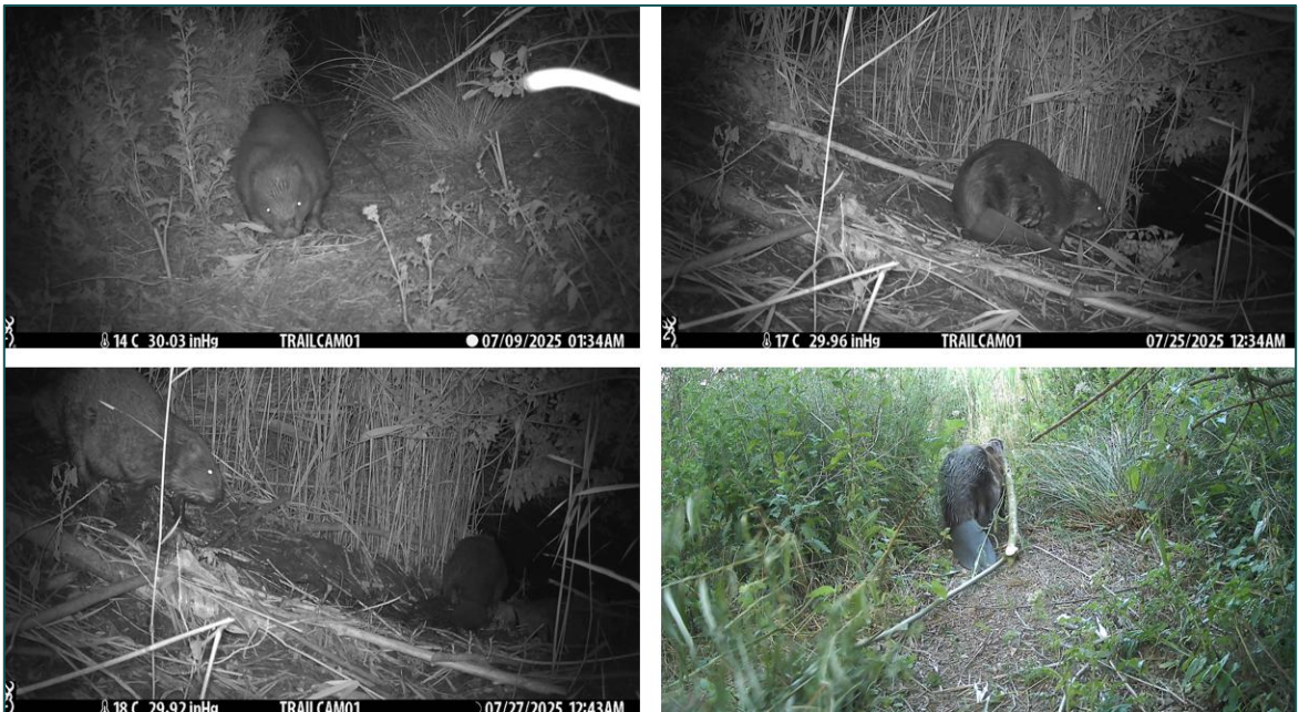
Figuur 3.3 Op camera's 51, 55, en 56 zijn een groot aantal waarnemingen gedaan van verschillende individuen.