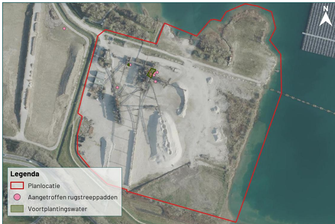
Figuur 3.5 Overzicht van de scheplocaties binnen het onderzoeksgebied.

In de nieuwe situatie wordt voorzien in de aanleg van nieuwe natuur en herinrichting van het terrein, waarmee compenserende en mitigerende maatregelen getroffen kunnen worden die de geschiktheid van het gebied voor algemene amfibiesoorten waarborgen.