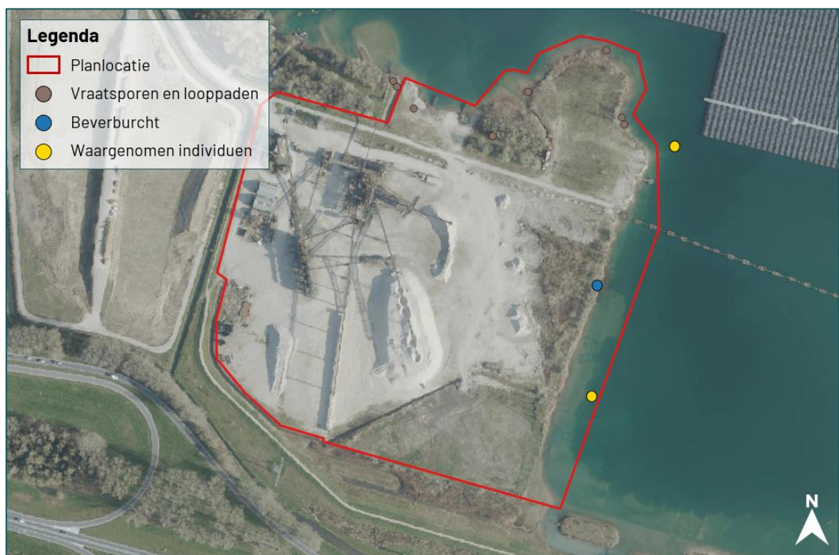
Figuur 3.1 Gedurende het onderzoek zijn er meerdere sporen (vraatsporen/looppaden), individuen en een beverburcht aangetroffen. Derhalve leidt de beoogde ontwikkeling tot aantasting van essentieel leefgebied van de bever.

Op de planlocatie is tevens sprake van essentieel leefgebied van de bever door de hoge mate aan visueel bewijs op de wildcamera's én de aanwezigheid van sporen (c.q. vraatsporen en looproutes ) binnen de planlocatie. Gezien het aantal waarnemingen van bevers en de aanwezigheid van sporen is er sprake van essentieel leefgebied van de bever.