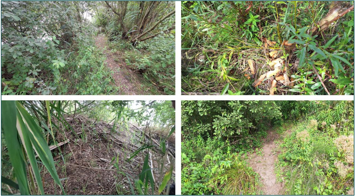
Figuur 3.2 Binnen de planlocatie zijn er op verschillende locaties vraatsporen, looppaden en een burcht van bever aangetroffen.