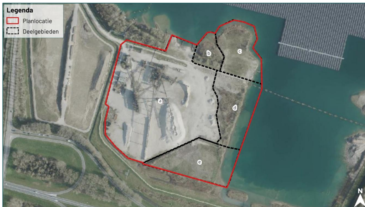
Figuur 1.2 De planlocatie (rood omkaderd) is gelegen aan de Laarstraat e.o. en is verdeeld in een aantal deelgebieden (zwarte stippellijnen).

De planlocatie is gelegen aan de Laarstraat e.o. te Deest en betreft een voormalig installatieterrein van ongeveer 9 ha. De planlocatie is verdeeld in vijf deelgebieden (A t/m E) welke hieronder weergegeven worden (figuur 1.2). De beoordeling wordt gedaan aan de hand van de verschillende deelgebieden. Een deel van deelgebieden A en deelgebieden D en E worden vergraven voor zandwinning, en na afronding van deze werkzaamheden opgeleverd als bedrijventerrein, open water en natuurgebied. Deelgebied B en C blijven behouden en worden niet afgegraven. Langs de oevers van de zandwinplas worden na afronding van de graafwerkzaamheden doormiddel van suppletie nieuwe eilandjes en moeraszones aangelegd. De bestaande natuur blijft daarbij behouden en wordt verder de waterplas in gerealiseerd. Een uitgebreide beschrijving van de planlocatie en de directe omgeving hiervan is te vinden in de quickscan Natuur (Bezemer, 2025).