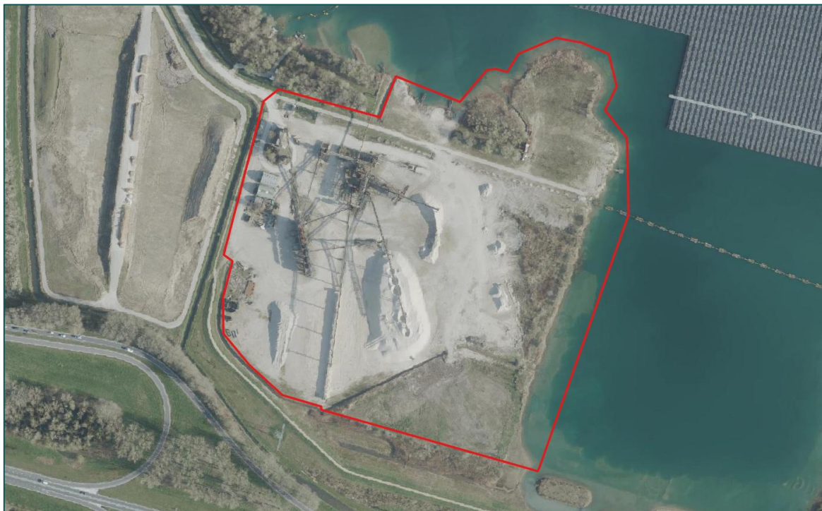
Figuur 1.1 De planlocatie is gelegen te Laarstraat e.o. te Deest.

Aan de Laarstraat e.o. is een voormalig installatieterrein (zandwinning) van 9 ha gesitueerd (figuur 1.1). De initiatiefnemer is voornemens om op een deel van het terrein de overgebleven grondstoffen te delven en de locatie vervolgens in te richten als bedrijventerrein (3 ha) en natuurgebied (6 ha).