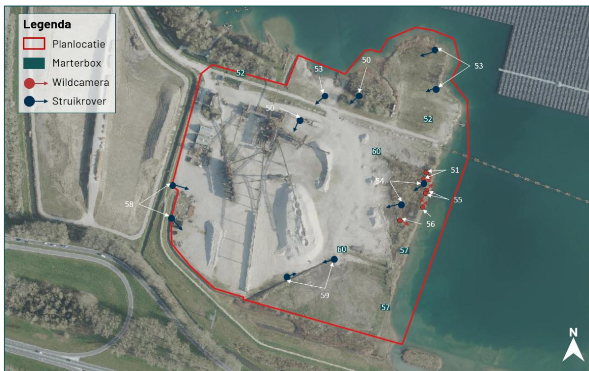
Figuur 2.2 Overzicht van de locaties van de marterboxen, struikrovers en cameravallen.

Naast het plaatsen van wildcamera's, marterboxen en sporenbuizen is tijdens elk veldbezoek specifiek een sporenonderzoek uitgevoerd. Hierbij is gezocht naar sporen die duiden op de aanwezigheid van marterachtigen en/of verblijfplaatsen. Dit betreffen sporen als graafsporen, latrines met uitwerpselen, prooiresten, prenten en vraatsporen.