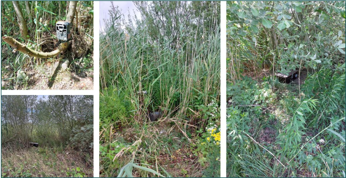
Figuur 2.3 Visuele weergave van enkele geplaatste marterboxen, cameravallen en struikrovers.