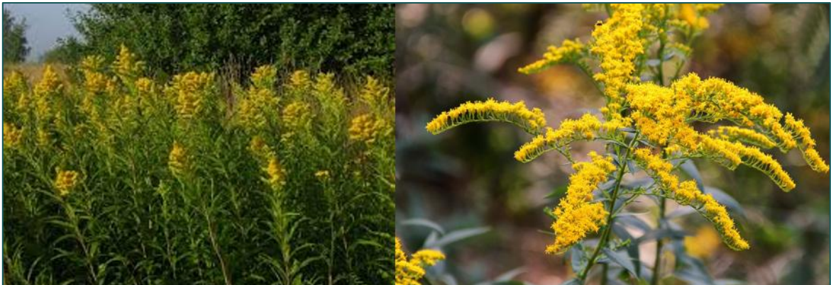
Figuur 1 Groeibeeld van de Canadese en Late guldenroede.

De Late guldenroede is voornamelijk te herkennen aan de pluimvormige bloeiwijze met gele bloemen. De soorten bloeien in de periode juli-september/oktober. De stengels van de planten staan rechtop en kunnen tot ca. 1,5 m hoog worden. De bladeren zitten verspreid aan de stengel en zijn langwerpig tot lancetvormig met een fijn gezaagde bladrand. De onderkant van de bladeren van de Canadese guldenroede is behaard en groen. De onderkant van de bladeren van de Late guldenroede is blauwgroen. Daarnaast is de stengel van de Canadese guldenroede helemaal behaard. Bij de Late guldenroede is enkel de stengel bij de bloemen behaard.