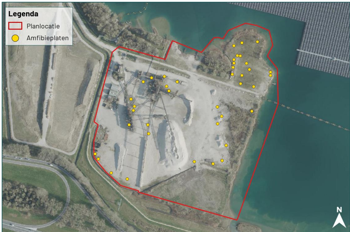
Figuur 2.4 Overzicht van de locaties van de amfibieënplaten in het plangebied.