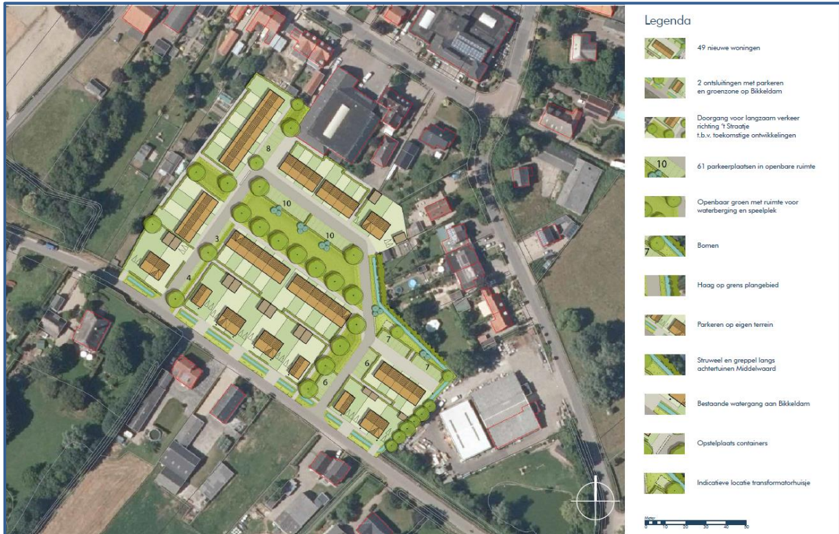
Afbeelding 2. Toekomstige inrichting