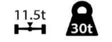
Figuur 4.3: Specifieke kenmerken van hulpdienstvoertuigen

PROJECT : Puiflijk, Houtsestraat 14 ONDERWERP : Bereikbaarheid brandweer