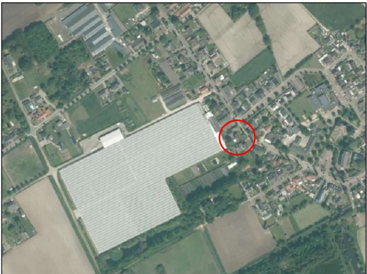
Afbeelding 1: Luchtfoto locatie Poorterweg 101 (rood omcirkeld).

De halfopen ontginningslandschappen liggen ten noorden van de lijn Meijel, Helden en Baarlo. Ten zuiden daarvan zijn de contrasten tussen zeer open en dichte gebieden groter.