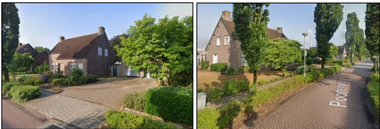
Afbeeldingen 4-5: bestaande woning

In de huidige situatie is op het perceel een (bedrijfs)woning aanwezig met een garage/berging. Zie hiervoor onderstaande afbeeldingen.