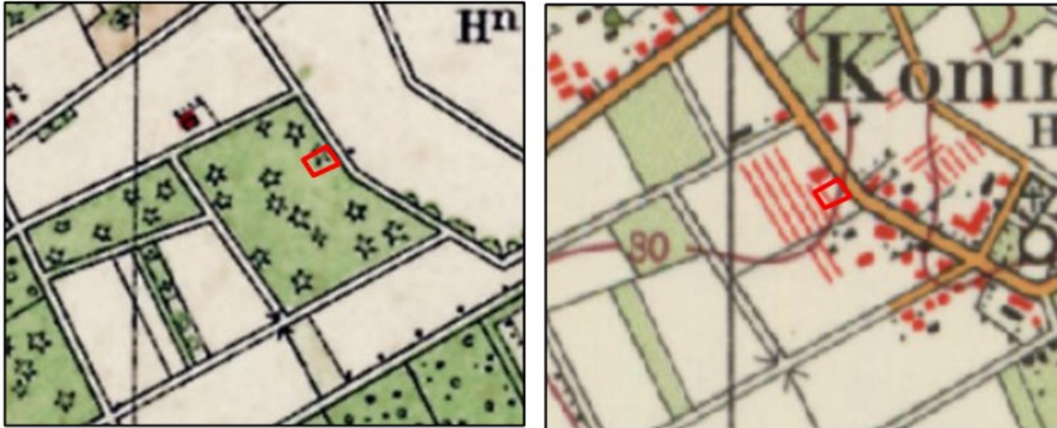
Afbeelding 2-3. Uitsnede topografische kaarten 1934 (links) en 1978 (rechts). Poorterweg 101 is rood omlijnd.

Met de benodigde groene invulling van de locatie dient rekening te worden gehouden met de landschapskarakteristiek van het omliggende gebied. Waar mogelijk moeten de aanwezige waarden worden versterkt.