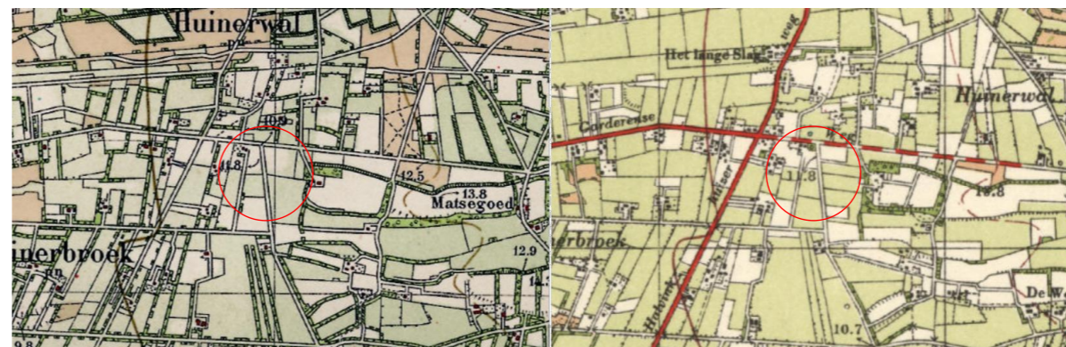
Figuur 6: Projectlocatie vanaf 1932 (links) en 1952 (rechts).

Op de kaart vanaf 1932 is ook de lichte mate van beplanting in het ontginningenlandschap herkenbaar. Vanaf 1952 zijn deze weer niet te zien op de kaart. De beplanting in het kampenlandschap wordt ook minder. De Blarinckhorsterweg krijgt de vorm en richting zoals deze er hedendaags bij ligt. Hoewel er nog geen bebouwing is, vormen ook de percelen van de projectlocatie zich steeds meer.