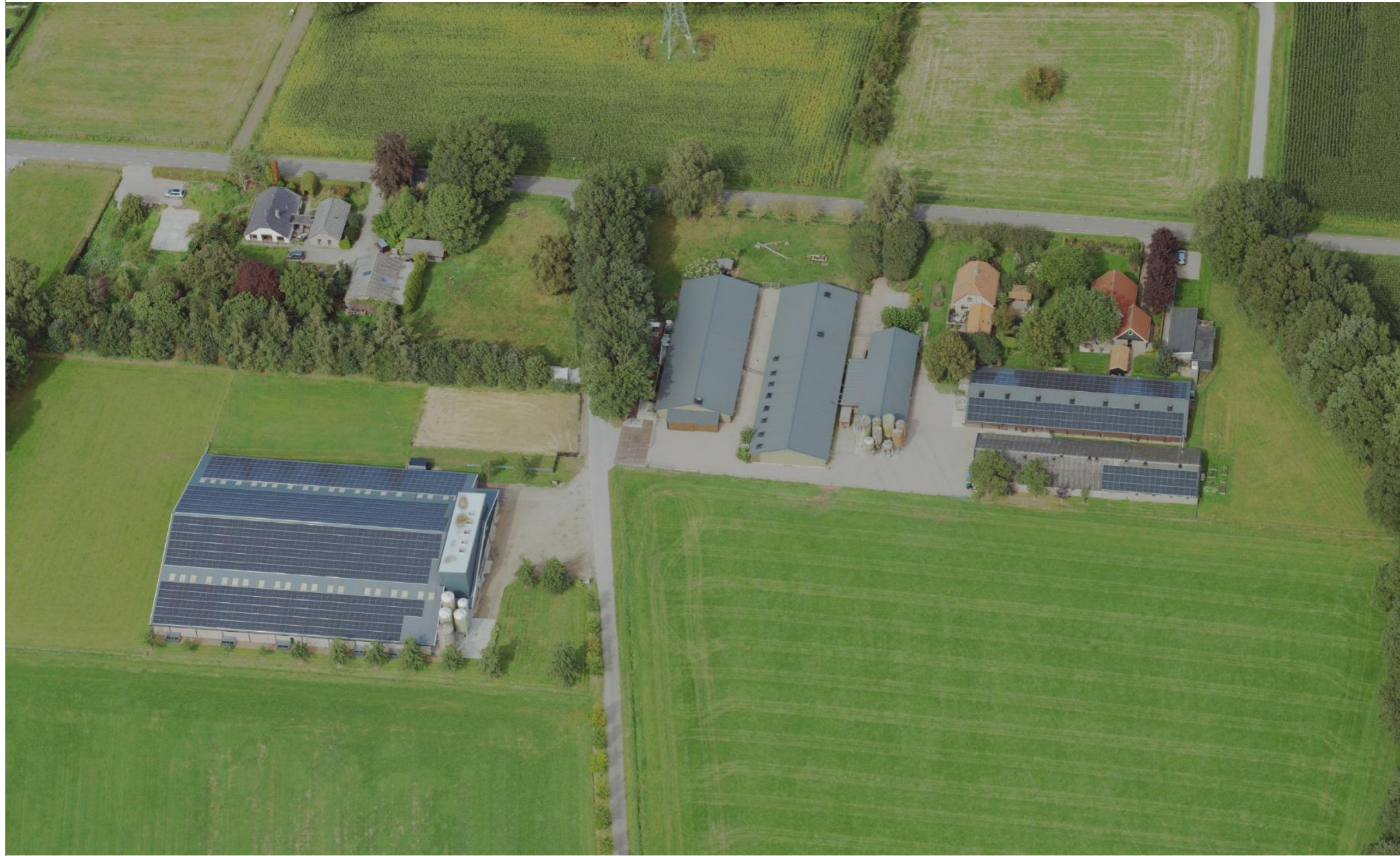
Figuur 1: Projectlocatie.

Om dit mogelijk te maken wordt de bestemming op de verschillende percelen gewijzigd. In dit rapport wordt gekeken naar invulling van de bestemmingsvlakken van de huidige situatie en de nieuwe situatie. Daarnaast is er onderzoek gedaan naar het landschap en de omgeving en de uitgangspunten en kenmerken. Aan de hand van dit onderzoek is vervolgens een landschappelijk inpassingsplan gemaakt voor twee opties voor de nieuwe situatie.