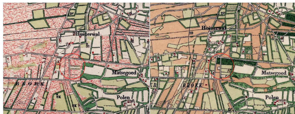
Figuur 5: Projectlocatie vanaf 1892 (links) en 1912 (rechts).

Op de kaart vanaf 1892 is te zien dat de ontginning en daarmee de verkaveling rond de projectlocatie is doorgezet. De rationele opzet blijft kenmerkend. De groenstructuur van het kampenlandschap blijft behouden. Ook vanaf 1912 zijn deze kenmerken terug te zien. Verder valt op dat vanaf 1912 een groot deel van de projectlocatie een groenbestemming had. De houtsingel aan de linkergrens van het perceel aan de Blarinckhorsterweg en het groen aan de rechtergrens van de percelen aan de Oude Nijkerkerweg zijn hier al herkenbaar.