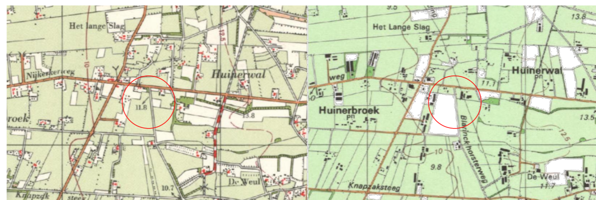
Figuur 7: Projectlocatie vanaf 1961 (links) en 1986 (rechts).

Vanaf 1961 is er aan de Oude Nijkerker weg bebouwing te zien op de projectlocatie. In de omgeving is sprake van ruilverkaveling waardoor de kavels groter worden. De beplanting is nu nog steeds minimaal. Tussendoor verandert er op de kaart vanaf 1974 weinig. Vanaf 1986 is te zien dat de bebouwing op de projectlocatie verder uitbreidt.