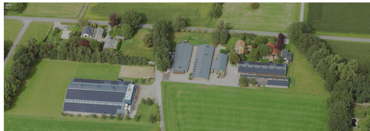
Figuur 9: Projectlocatie.

Op de projectlocatie is zowel de kleinschaligheid als het open karakter na schaalvergroting terug te zien. Bij de percelen aan de Oude Nijkerkerweg is ingezet op laanbeplanting en siervoortuinen. Aan de rechtergrens van de percelen is een dichte groenstructuur in de vorm van laanbomen en een houtsingel. Het voorerf oogt hierdoor kleinschalig en besloten. Het bedrijfserf met de stallen is voorzien van weinig groen en heeft een open karakter. Dit open karakter is terug te zien bij de stal aan de Blarinckhorsterweg. Het grote gebouw is duidelijk in het zicht. Aan de noord- en oostzijde zijn bestaande houtsingels. Langs de weg is ingezet op het versterken van laanbeplanting en aan de zuidzijde is door middel van een rij elzen de erfgrans duidelijk weergegeven.