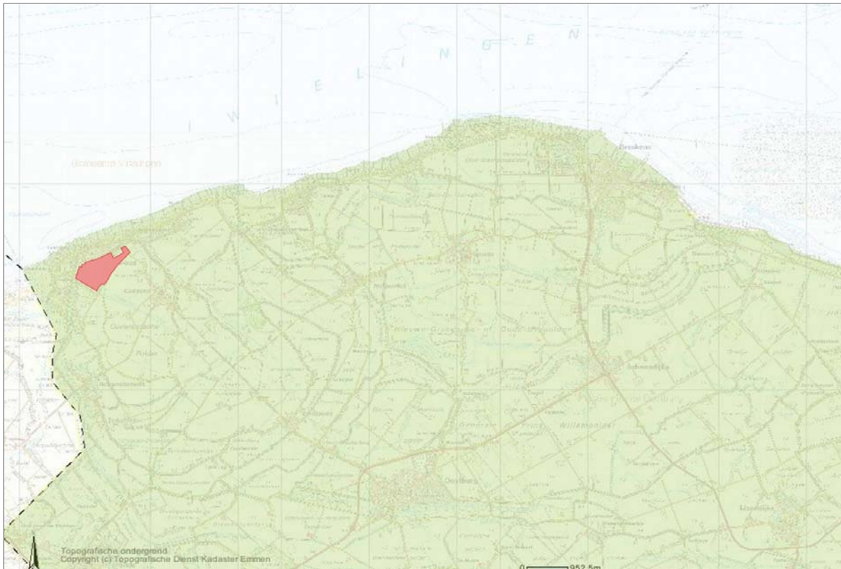
Figuur B1.1. Nationaal Landschap (groen) West Zeeuws-Vlaanderen en ligging plangebied daarbinnen (rood)