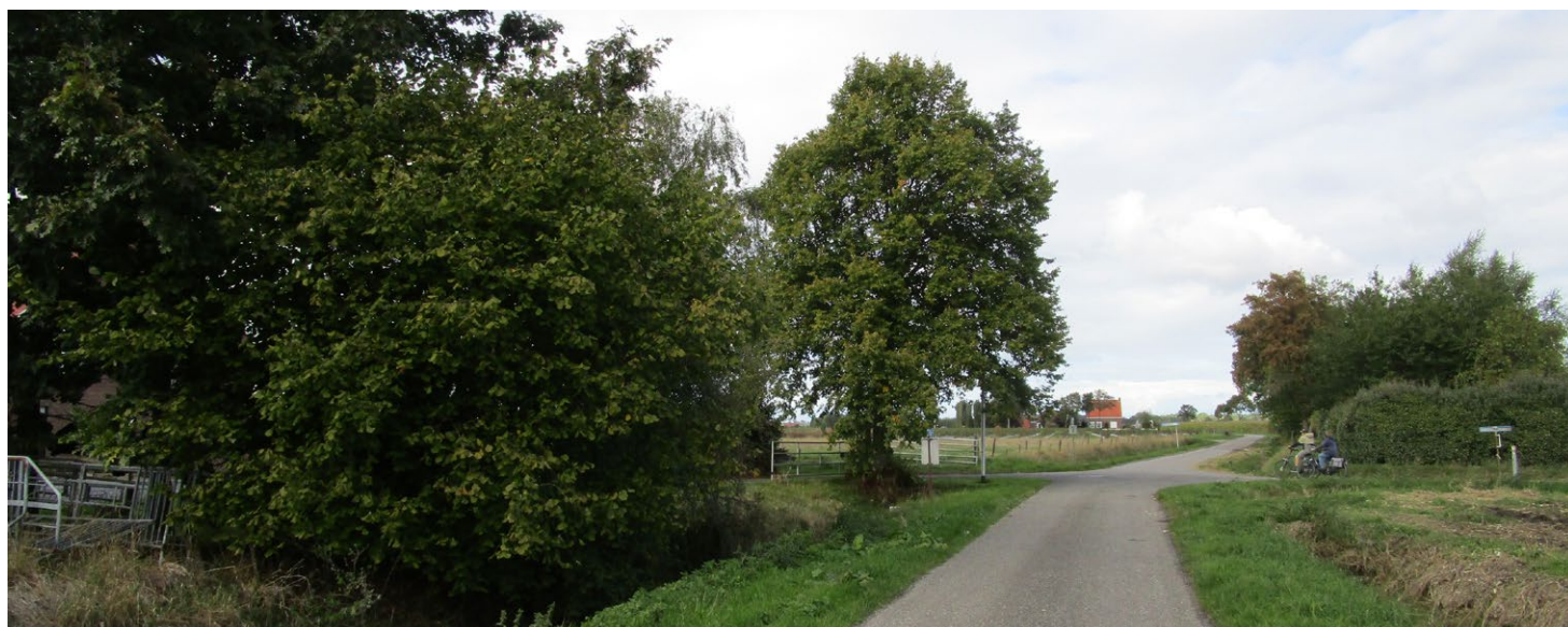
Zicht over de Nieuweweg in noordelijke richting.