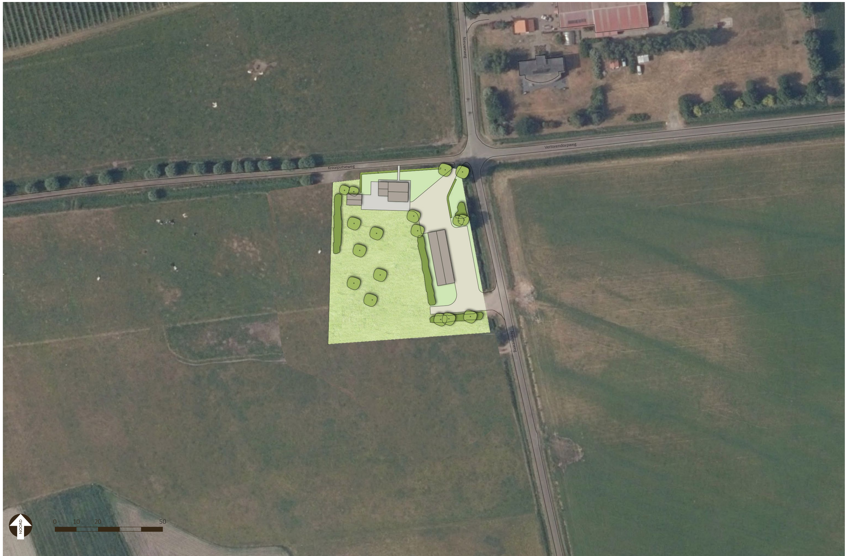
Luchtfoto bestaande met projectie landschappelijke inpassingsschets.