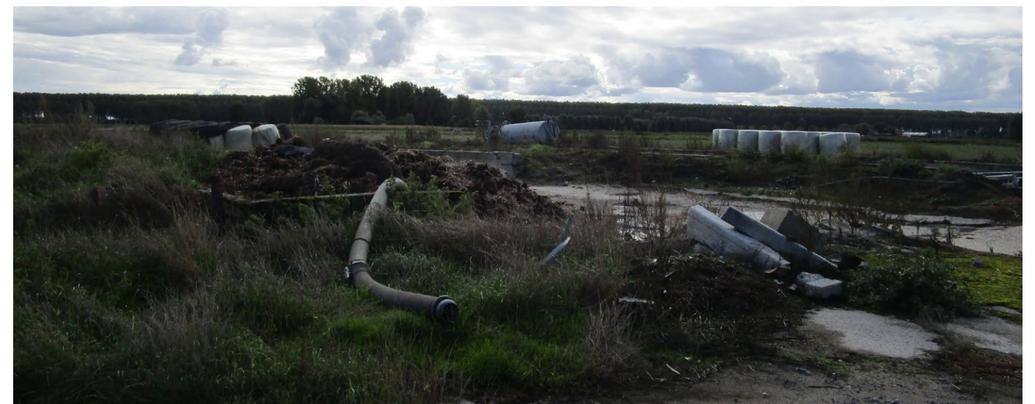
Sfeerbeelden bestaande bedrijfsbebouwing en omliggende ruimte.