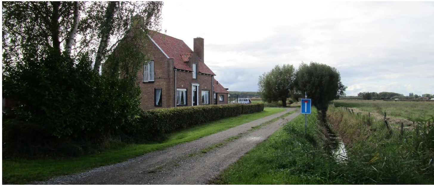
De bestaande woning met zicht op de knotwilgen langs de Kraaiputseweg.