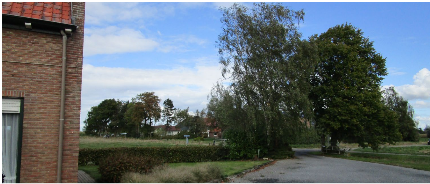
De solitaire bomen en het hekwerk markeren de toegang tot het erf en de woning.