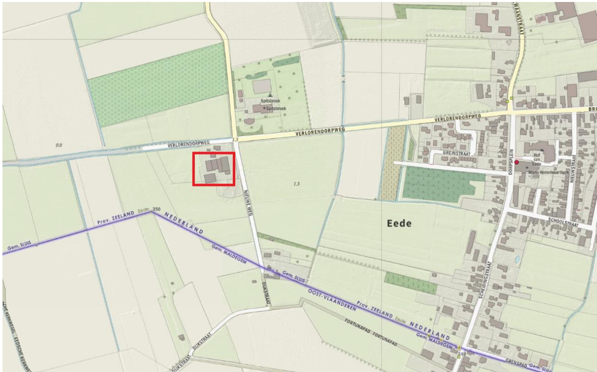
Figuur 1. Plangebied.

Het plangebied is bezocht op 1 oktober 2022. Daarnaast zijn lokale verspreidingsatlassen geraadpleegd, zijn gegevens opgevraagd en zijn openbare websites geraadpleegd.