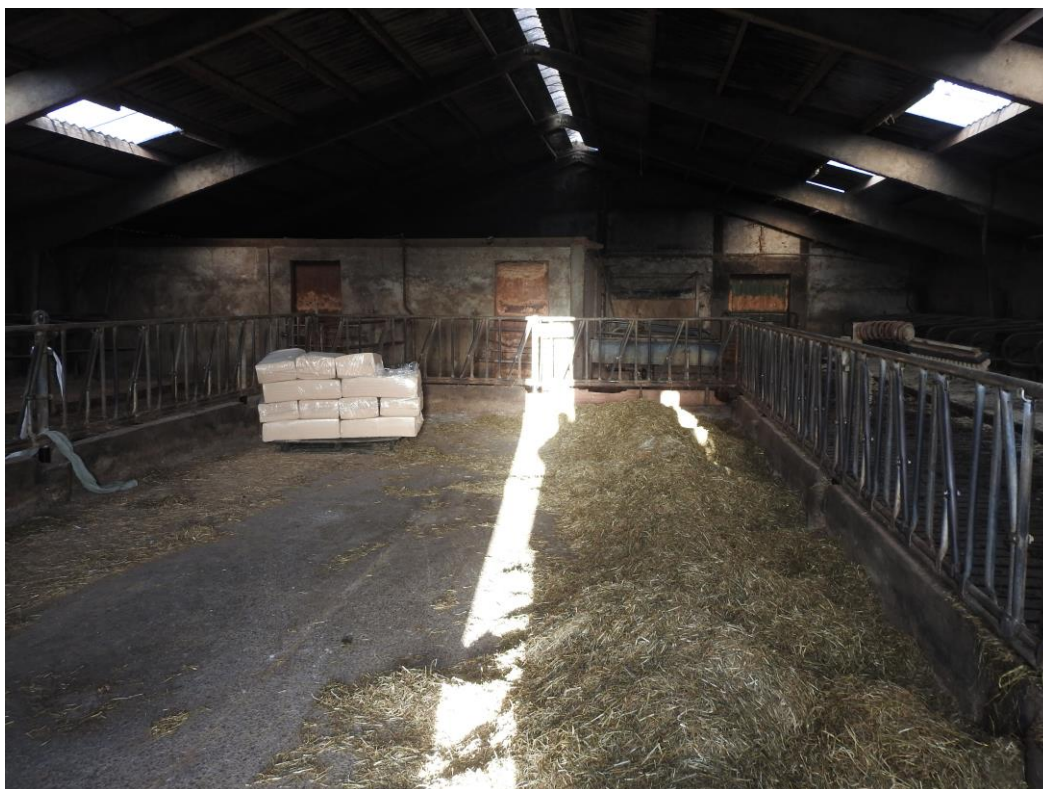
Foto 2. Plangebied, te slopen schuur.