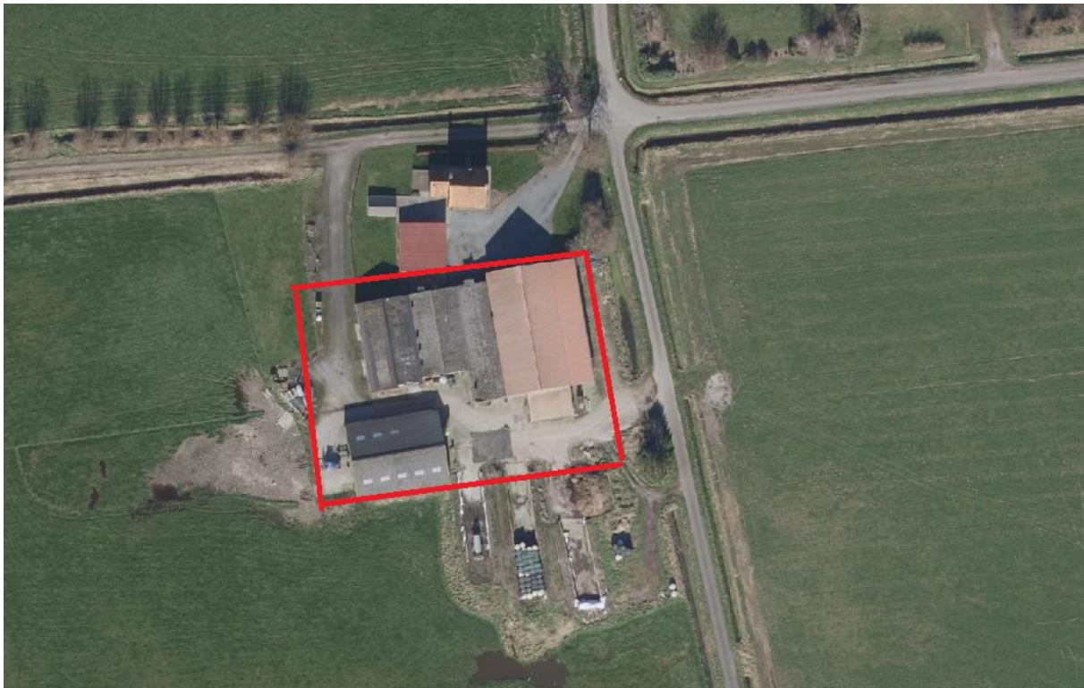
Figuur 2. Luchtfoto van het plangebied.

In dit hoofdstuk wordt een korte beschrijving gegeven van de huidige situatie. Het plangebied waar deze quickscan op van toepassing is, is gelegen ten westen van het dorp Eede. Het betreft een aantal geschakelde landbouwschuren gelegen op een erf. De schuren bestaan uit steen. De omgeving bestaat uit agrarisch gebied.